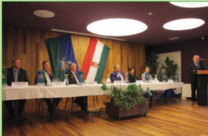
A fenyvesi képviselő-testület alakuló ülése

A várakozás idején, amikor a kampány időszakát éltük, mosolyogtató volt az a heves tenni akarás, amit a közösségi oldalakról felénk közvetítettek – mi ebben az esztendőben ebből szerencsére ki-maradtunk, nem volt versengés, illetve nem volt az „mindent egy lapra” jellegű. Persze ezzel nyertünk mindnyájan, Önök, Balatonfenyves, s természetesen én is, nyugodtan megkezdhattük