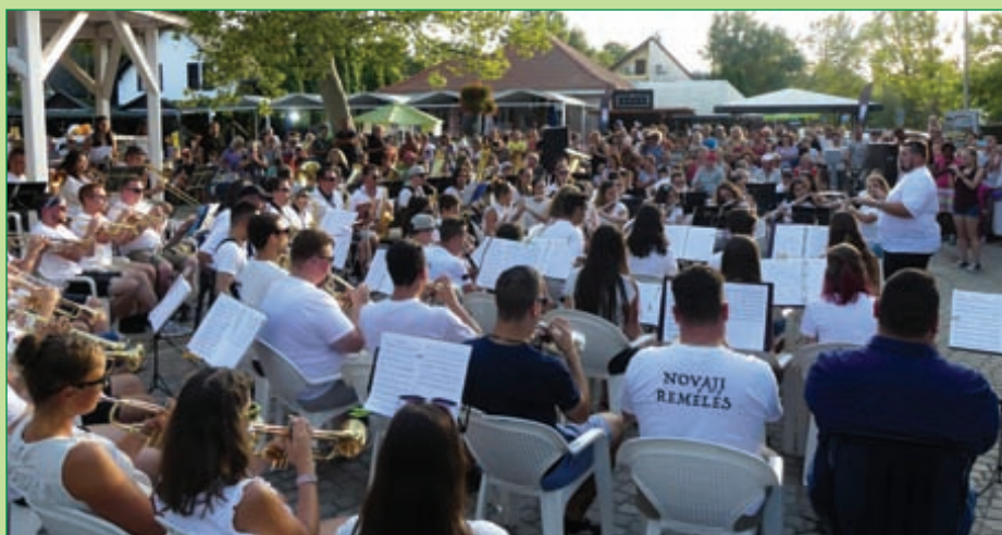
Band Camp koncert

Azok kedvéért, akik lemaradtak a programjainkról, álljon itt egy képes összefoglaló az augusztusi zenésztáncos estékből. (S. B.)