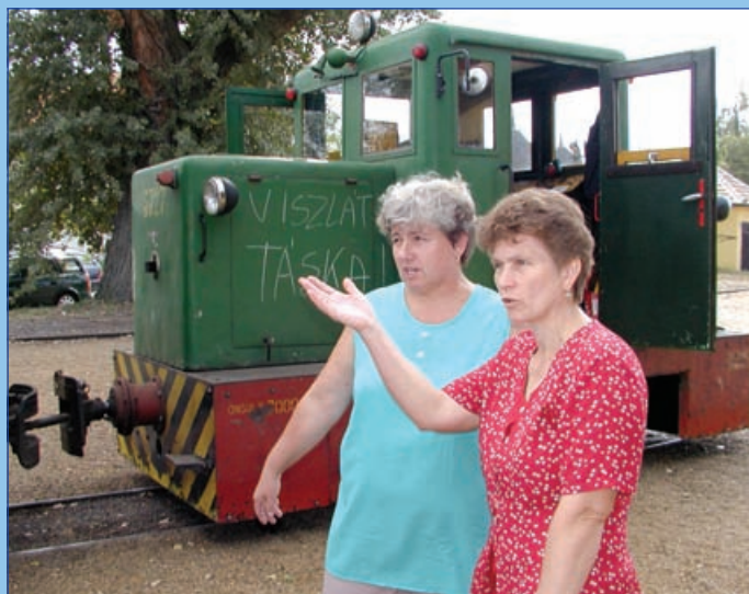
Elindul az utolsó kisvasúti járat Tászkára (2002.)