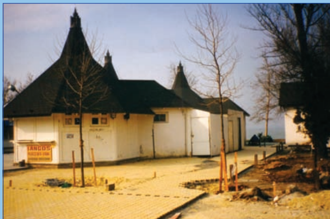
Térkövezés az üzletsornál (1996.)