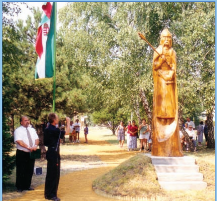
Géza fejedelem szobrának avatása (2001.)