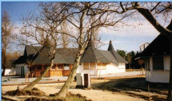
Épül a központi strand (1995.)