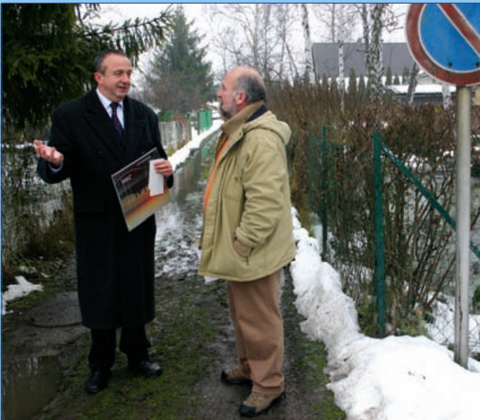
Persányi Miklós környezetvédelmi miniszter belvízszemlén (2006. január)