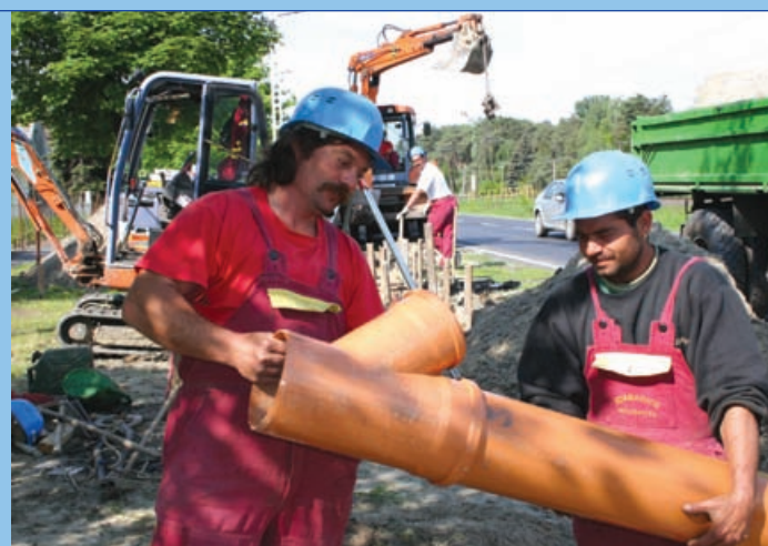
Folynak a csatornázás munkák (2004. május)