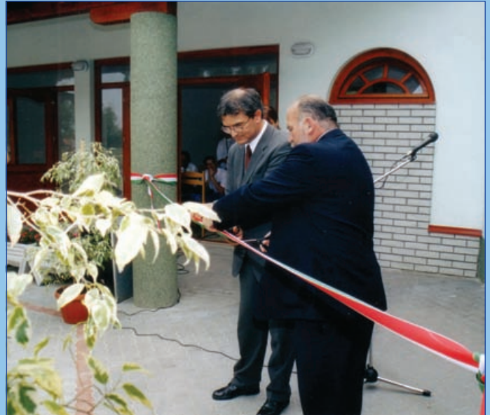
Átadják Fenyves alsó strandjának üzletsorát (2003.)