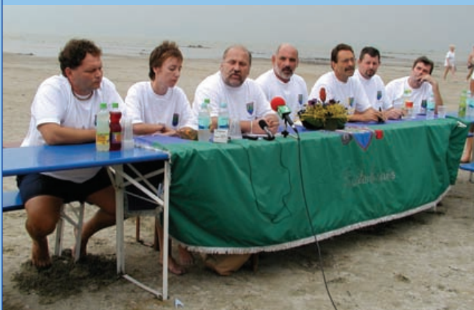
Kihelyezett testületi ülés a tó „szigetén” (2002. augusztus)