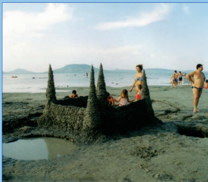
„Elfogy” a tó... (2002 nyara)