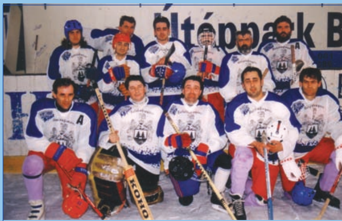
Székesfehérváron játszottak hokisaink (1996. március)