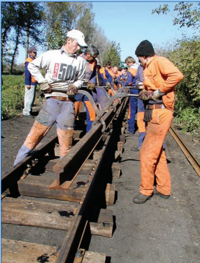
A kisvasút pályafelújítása (2002. október)