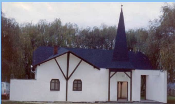
Elkészült az új ravatalozó (1994.)