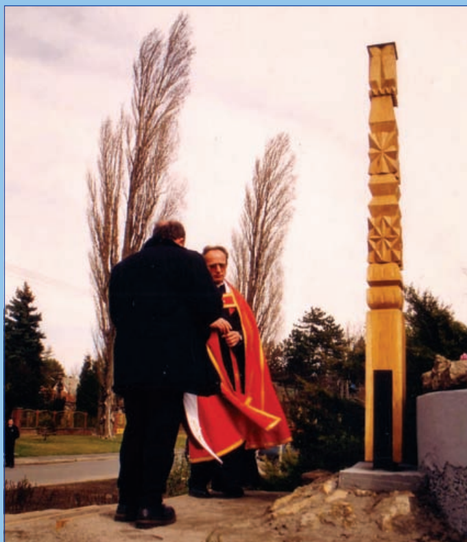
Kopjafa áll a községházánál (2000.)