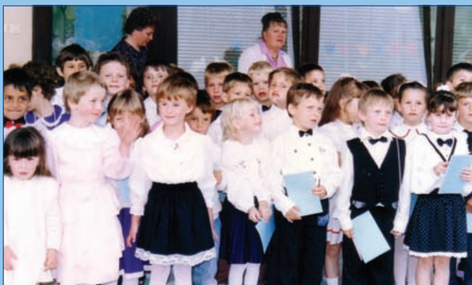
Óvodai évvzáró 1992-ben