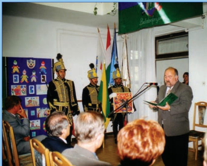
Megyecímer átadáson (2001.)