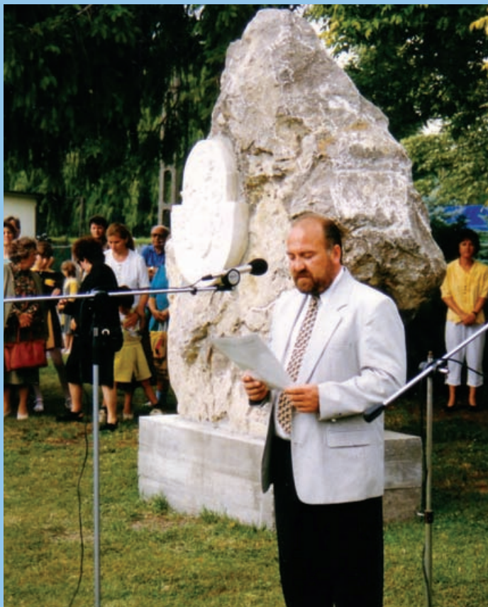
A Centenárium emlékkő avatása (1996.)