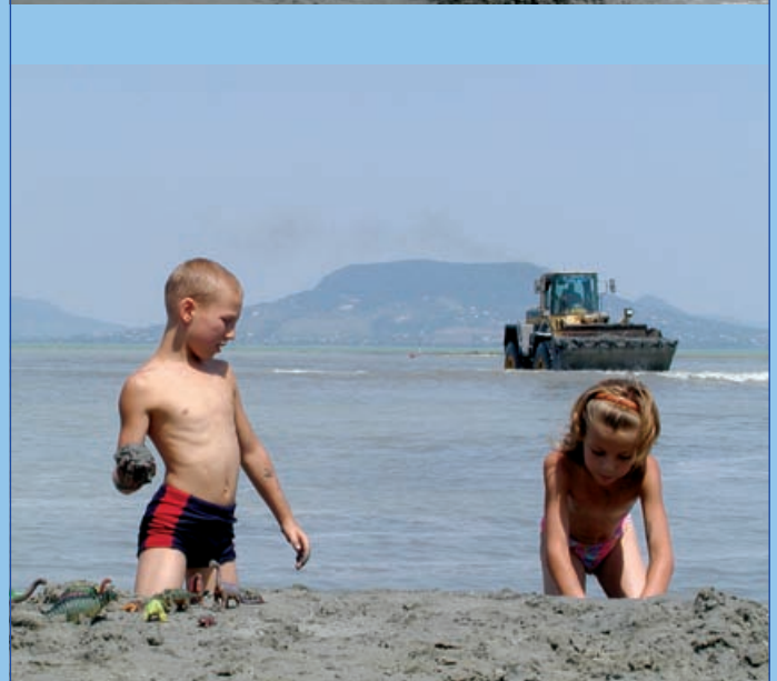
Kotorják a Balatont Fenyvesnél (2003. június)