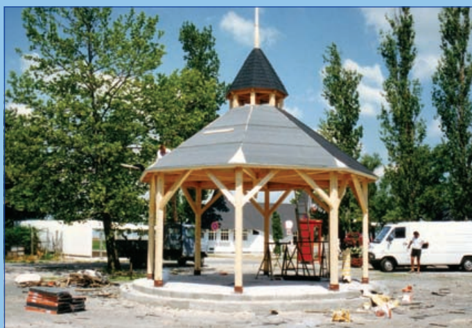
Épül a Zenepavilon (2000. nyara)