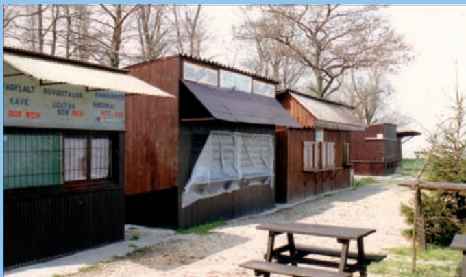
A Csalogány üzletsor a 90-es évek elején