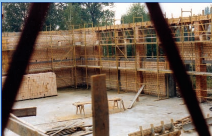
A Sportcsarnok építése (1994.)