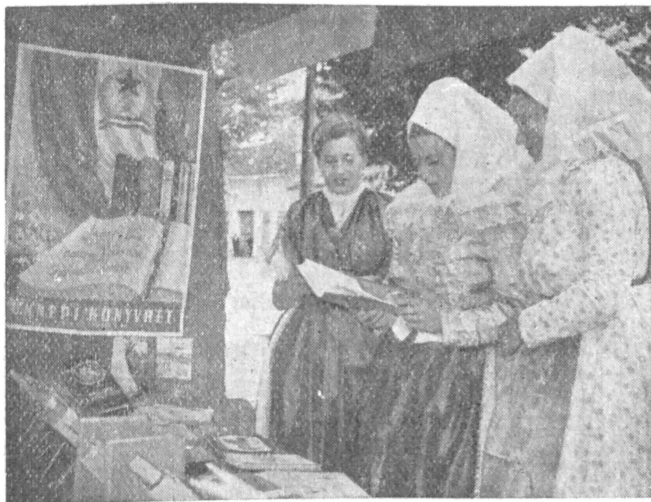
Tavalyi ünnepi könyvhét falun