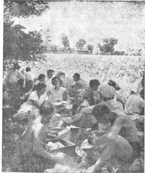
A gyomai Járasi Könyvtár szervező könyvtárosa felolvas a cséplési ebéd-szünetben

Az ököritőfülpösi népkönyvtár igen nagy forgalmat bonyolít le, havonta rendszeresen több mint 1200 kötet könyvet kölcsönöz ki. Ha a tanács a népkönyvtáros személyét nem is tekinti, legalább a község lakosainak, az olvasóknak érdekét kellene, hogy nézze. És nemcsak tüzelőt és világítást kellene biztosítania a népkönyvtárnak, hanem megfelelő helyiséget is, hiszen erre, mint Hegedüs Gábor le-