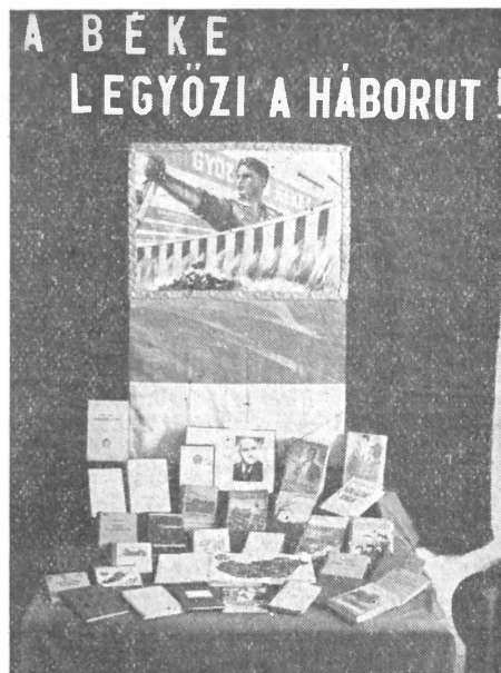
Az izsáki népkönyvtár állandó könyvkiállítása

A levelekben azonban nemcsak kérés és panasz van. Minden könyvtáros örömmel számolt be munkájáról. Igen sok az olyan levél, amelyet szinte teljes egészében érdemes lenne közölni, annyi ötlet, helyes kezdeményezés, ügyes és jó munkamódszer van bennük. A választási jó munkájukért megjutalmazott könyvtárosok a választások után sem lankadtak, ha-