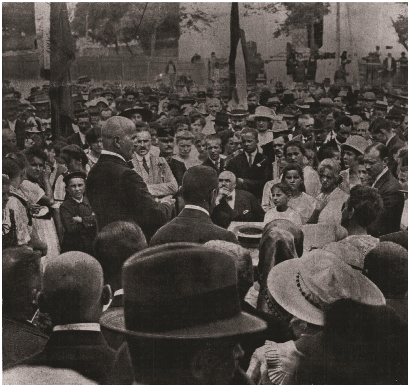
Rubinek Gyula kereskedelmi miniszter beszél a Faluszövetség balatonfüredi rendezvényén