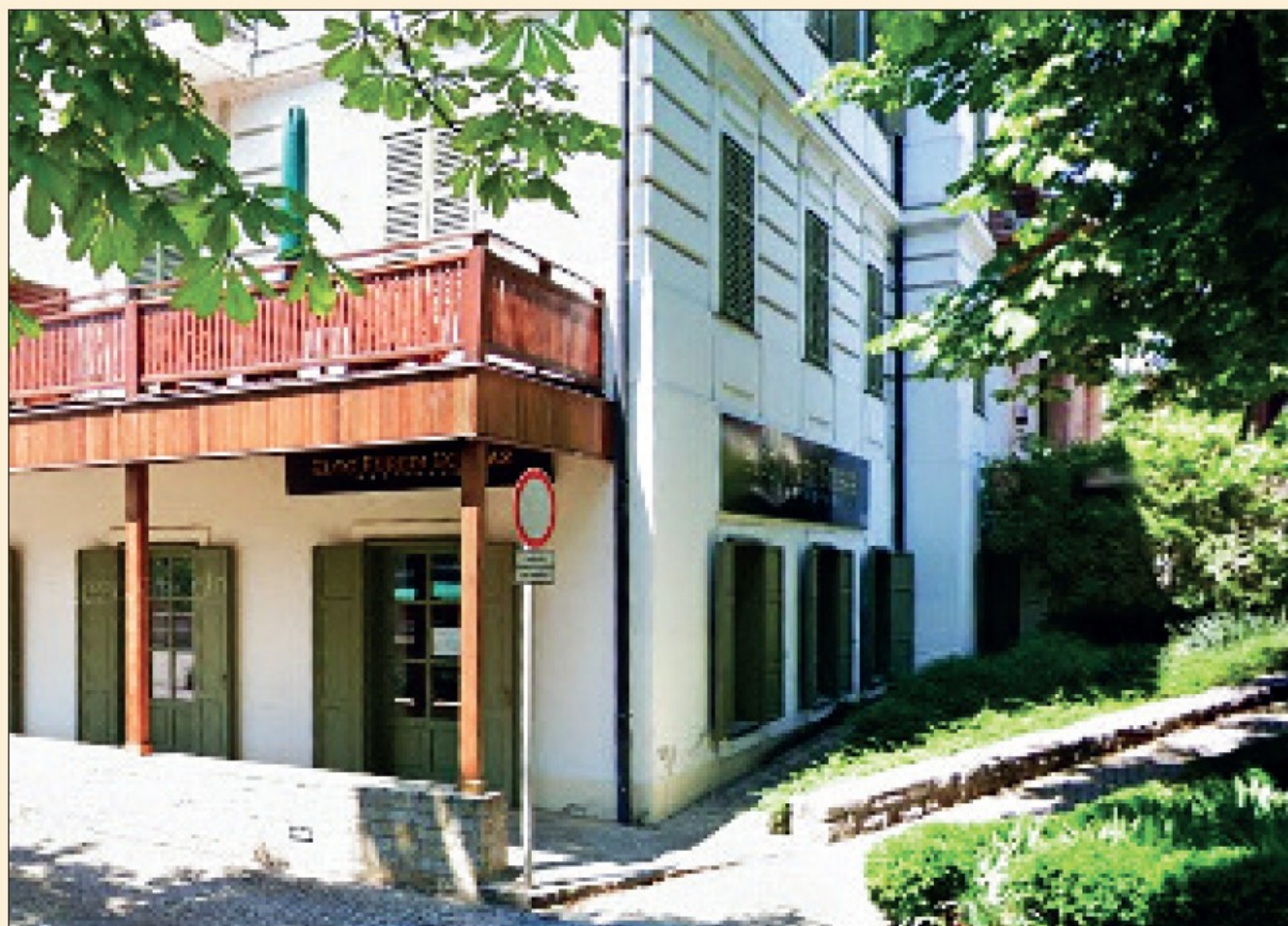
A Horváth ház Gyógy téri homlokzata a Balaton felől napjainkban A Héjj Testvérek egykori balatonfüredi fióküzlete helyén jelenleg a Tagore Medical Center működik.