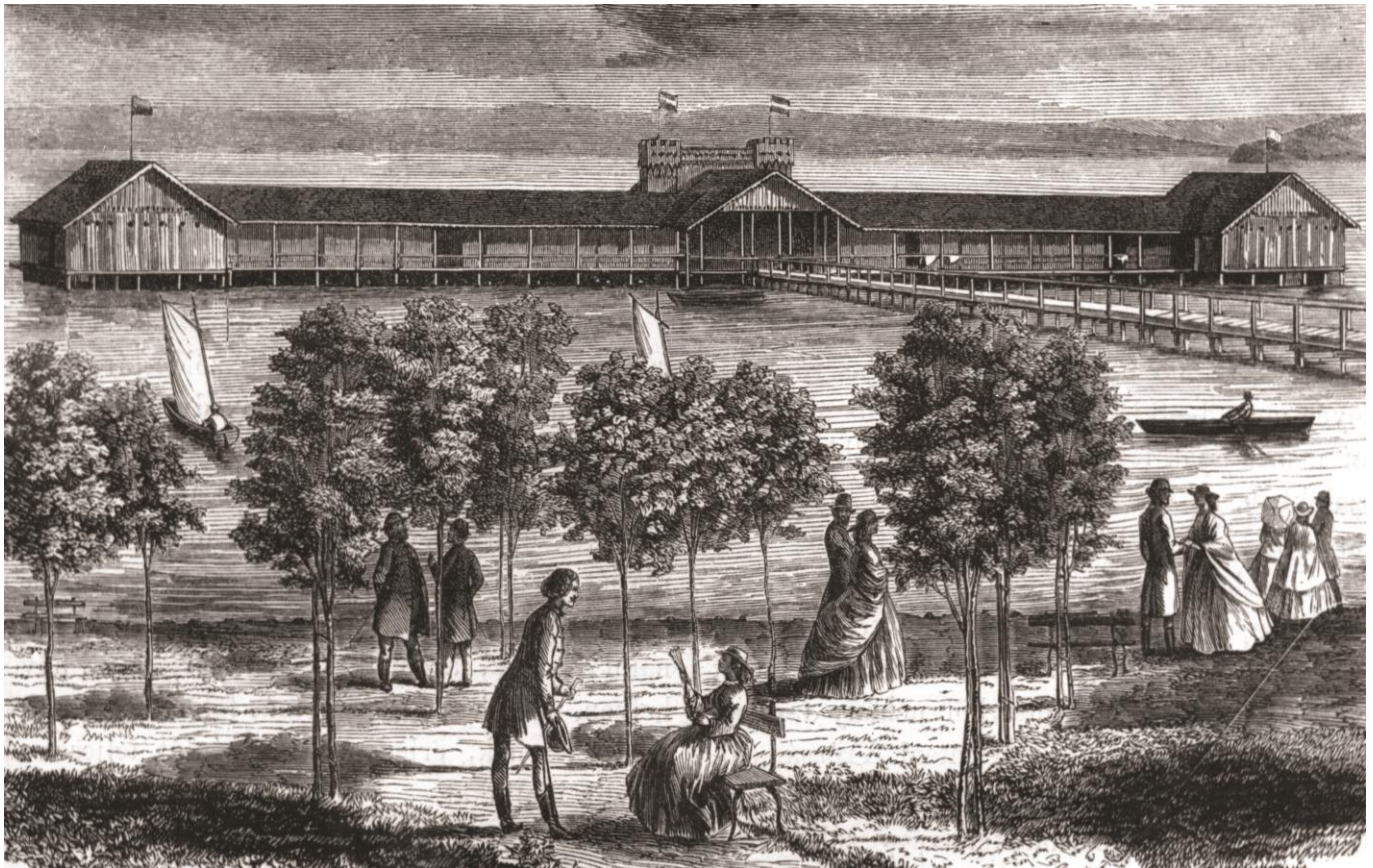
Lengyel Samu fotója alapján 1866-ban készült grafika a füredi tópartról, a sétányról és a hidegfürdőről ( Hazánk s a Külföld , 1866. szeptember 9.)