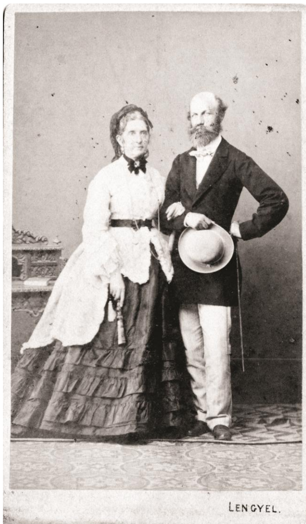
A Jókai házaspár 1873-ban a füredi Lengyel műteremben készült fotón