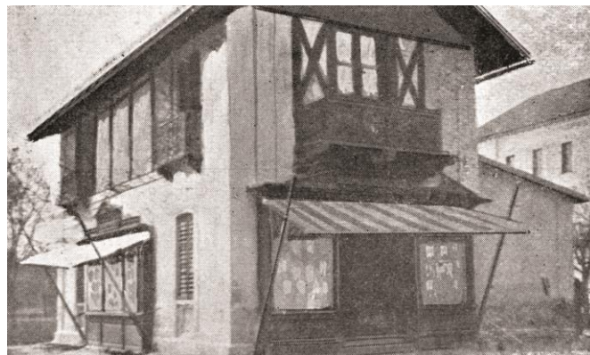
Az épület 1914-ben (Balatonfüred gyógy-és tengerfürdő. 1914. 52. p.)