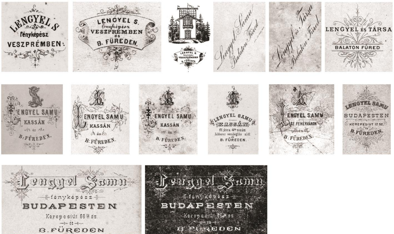
Lengyel Samu fényképeinek verző típusai 1861 és 1887 között

A külön nem jelölt fotók és fotórészletek a Balatonfüredi Városi Gyűjtemény fotógyűjteményéből származnak.