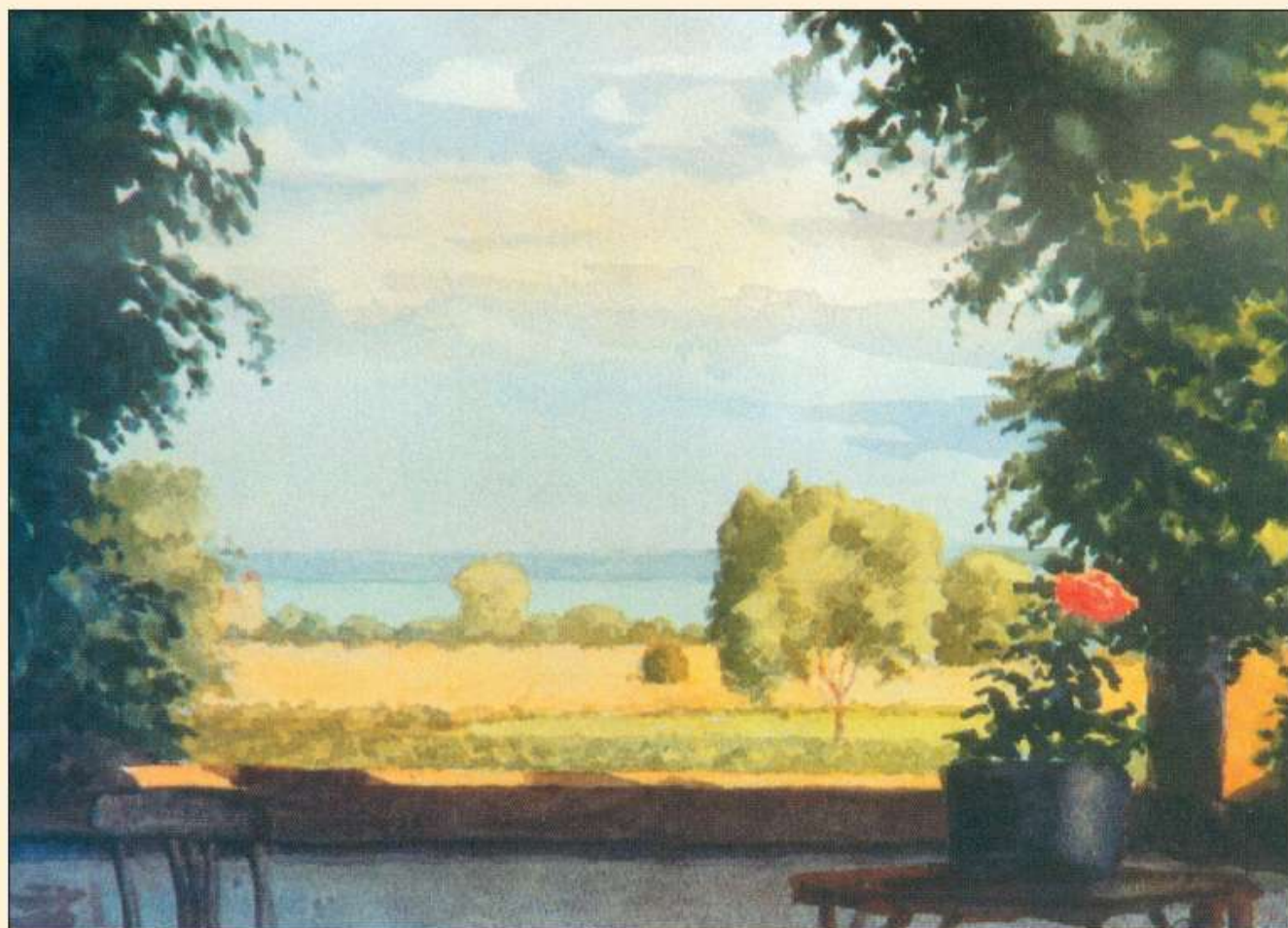
Kilátás a balatonarácsi Csolnoky-nyaralóból a Balatonra