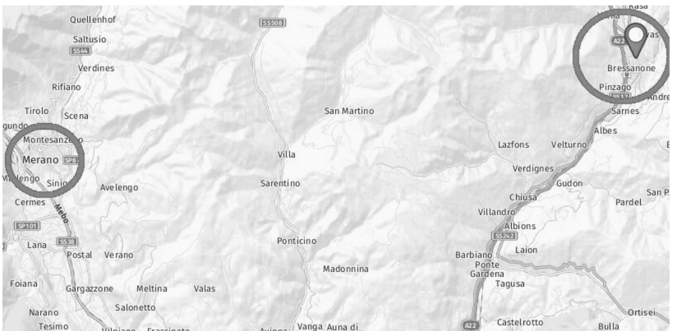
Az egykori Meran (a színésznő halálának korábban feltételezett) és Brixen (a halál tényleges helyszíne) térképen