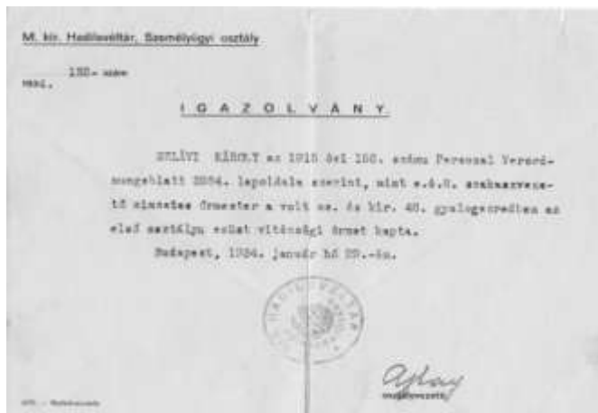
Igazolás Szlávi Károly kitüntetéséről

SZLÁVI [1902-ig SCHMUTZER] Károly (Tótvázsony [Veszprém megye], 1894. április 17. – Debrecen, 1949. május 14.) A Kozma utcai zsidó temetőben nyugszik, 5C Parcella, 5. Sor, 27. sírhely.