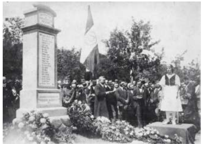
Az arácsi emlékmű avatása