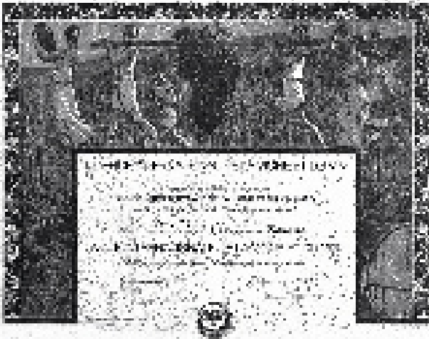
Balatonfüred a Szőlő és Bor Nemzetközi Városa díszoklevele (1987)