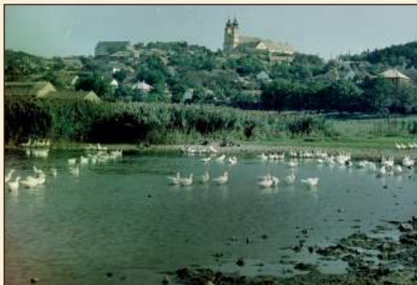
Tihanyi életképek