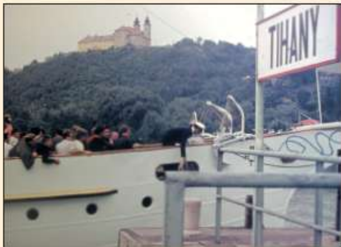
Tihany: kikötő és a Piski sétány, háttérben az apátsággal