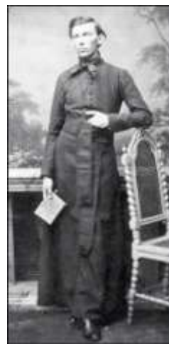
Jalsovics Aladár (1833 – 1897) füredi plébános

Az alakuló egylet „buzgó harcosai” között találjuk a fürdőhely tevékeny plébánosát, Jalsovics Aladárt (1833 – 1897), akinek 1878-ban megjelent könyve nemcsak a füredi „fürdőirodalom” egyik legérdekesebb alkotása, hanem a korszak legrészletesebb dunántúli útikalauza is. 44 A Balaton vidék fejlesztése érdekében nemcsak jelentős irodalmi, hanem gyakorlati munkát is végzett, hiszen ő lett az egylet első pénztárnokaként a pénzügyek, a tagdíjak kezelője. 45