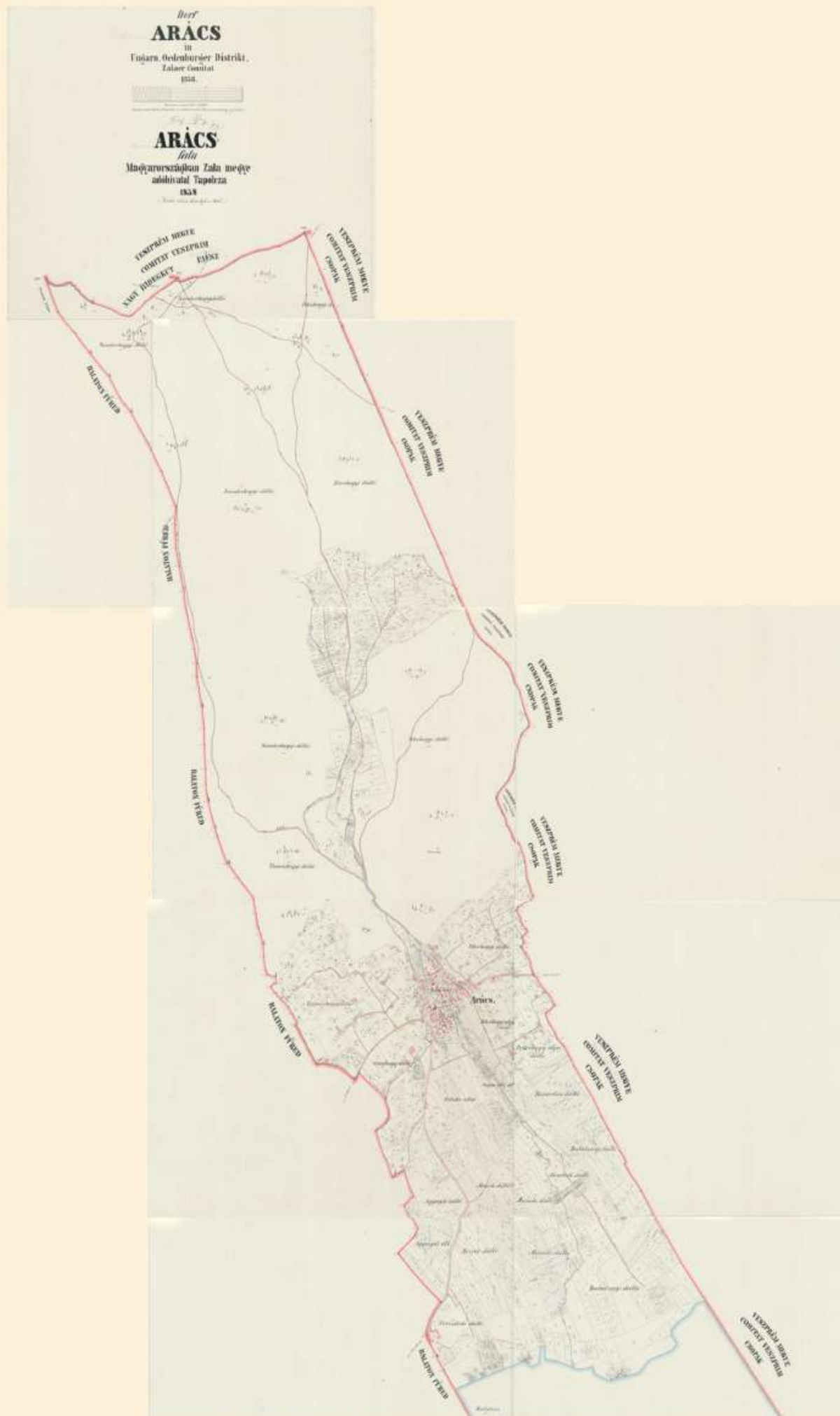
Arács falu kataszteri térképe 1858-ból