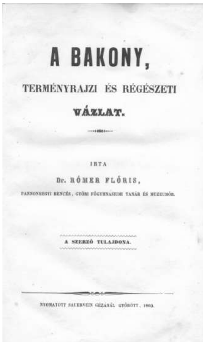
A Bakony címlapja