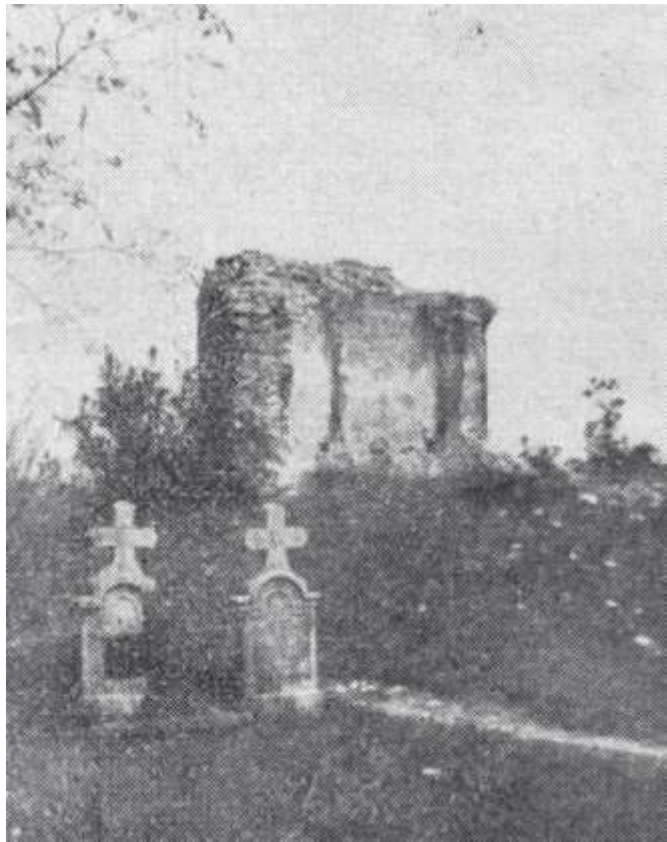
A siskei templom romja 1935-ben

sei, sokat köszönhetünk a nagyműveltségű tudós- nak, ezért nem hiányozhat a kibővített füredi élet- rajzi lexikonból sem.