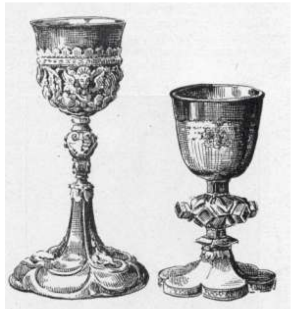
A református templom kelei

Könyvének címe azt sugallja, hogy csak a Bakonyban tett útjairól számol be, beleolvasva azonban kiderül, hogy 1859. szeptember végén Dörgicsén, Örvényesen, Füreden, Tihanyban, Paloznokon, Alsóörsön, Felsőörsön Szentkirályszabadján is járt. Művében fontos feljegyzéseket találunk, hiszen ez az első említése és leírása a füredi református gyülekezet által őrzött néhány tárgynak, elsősorban a két kehelynek. Velük kapcsolatosan a későbbi publikációkban mindig erre a művére, mint alapforrásra hivatkoznak. Itt olvashatunk először az egykori református iskola melletti, ma a Mogyoró utca burkolata alatt nyugvó római fürdő nyomairól is. Fontosnak tartotta megemlíteni a református egyház jegyzőkönyveinek beírásait, de Kisfaludy Sándor szobráról is fűz személyes megjegyzést.