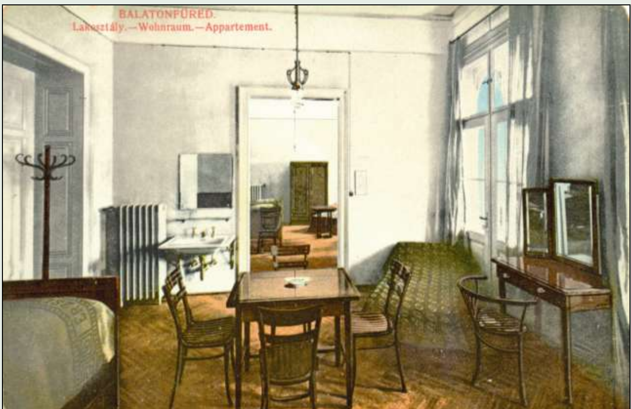
Az Erzsébet szanatórium (Városi Helytörténeti Gyűjtemény és Kiállítóhely) (1914)