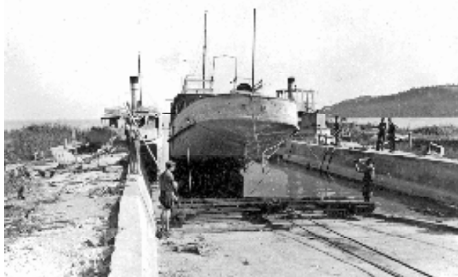
A hajók kiemelése a hajógyári sójában

A robbantásokat követő napon – 1945. március 25-én – Balatonfüreden és környékén véget értek a II. világháborús harci cselekmények. Ezek után sok más teendő között megkezdődhetett a hajók kiemelése és a hajózás visszaállítása a Balatonon. A fakomp, a Komp I. és a személyszállító hajók újjáépítési munkálatainak a személyi, tárgyi feltételei természetesen a füredi hajóépítő üzemben voltak adottak. Ezekben a munkálatokban vettek részt a hajóépítők és a hajósok, akik ugyanannak a BHRt-nek voltak a dolgozói 1948-ig.