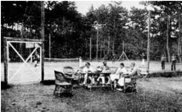
Életkép a kiserdei teniszpályánál, az 1930-as évek közepén 61

zas lüktető élet megcsitult, bár a fiatalság mindinkább növekvőben van Füreden. ... A tenniszezés már meg is kezdődött, dacára a hűvös időnek és hisszük, hogy a nyáron újra kivirágzik a környéken is nevéssé vált klubélet.” 60