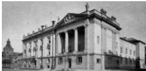
A Schack Galerie épülete

A 19. században egymás után jöttek létre az úgynevezett másolat-galériák, köztük a máig legnevesebb Schack Galerie Münchenben. Az alapító Adolf Friedrich von Schack képtárának 85 másolatát kortárs német festők, köztük Lenbach készítették. A jelentős vagyonnal rendelkező gróf a képeket személyes élmények alapján választotta ki utazásai során, a másolóktól pedig elvárta a mintakép aprólékos és pontos követését. A galériát létrehozó Schack és a számára legfontosabb festmények kópiáját elkészítő Lenbach évtizedes kapcsolatából egyenesen következett, hogy később a Lenbach igazgatta Akadémián a másolatkészítés is tantárggyá lépett elő.