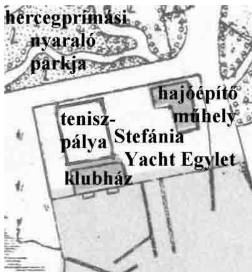
A fürdőtelep 1900-as térképének részlete, a Stefánia Yacht Egylet teniszpályájának utólag berajzolt helyével

Balatonfüred is lassan megváltozott: egyre inkább előtérbe került a gyógyászati jellege, a társasági élet az 1890-es évek elejétől áttevéődött a Balaton déli partján sorra megalakuló új fürdőhelyekre, az 1896-ban átadott balatonföldvárin például két teniszpálya is nyílt. A Stefánia Yacht Club udvarán levő teniszpályát a századfordulót követően csónakok és vitorlások tárolására használták.