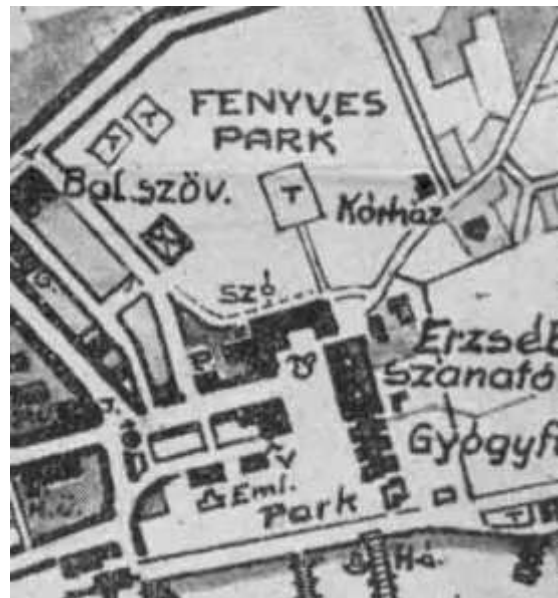
1935-ös térképrészlet A tennispályák "T" betűvel jelölve