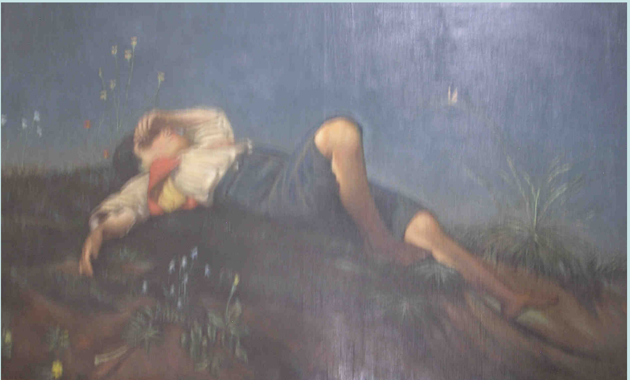
Protiwinsky Ferenc: Fekvő fiú – másolat Lenbach után (1913) (Városi Helytörténeti Gyűjtemény)