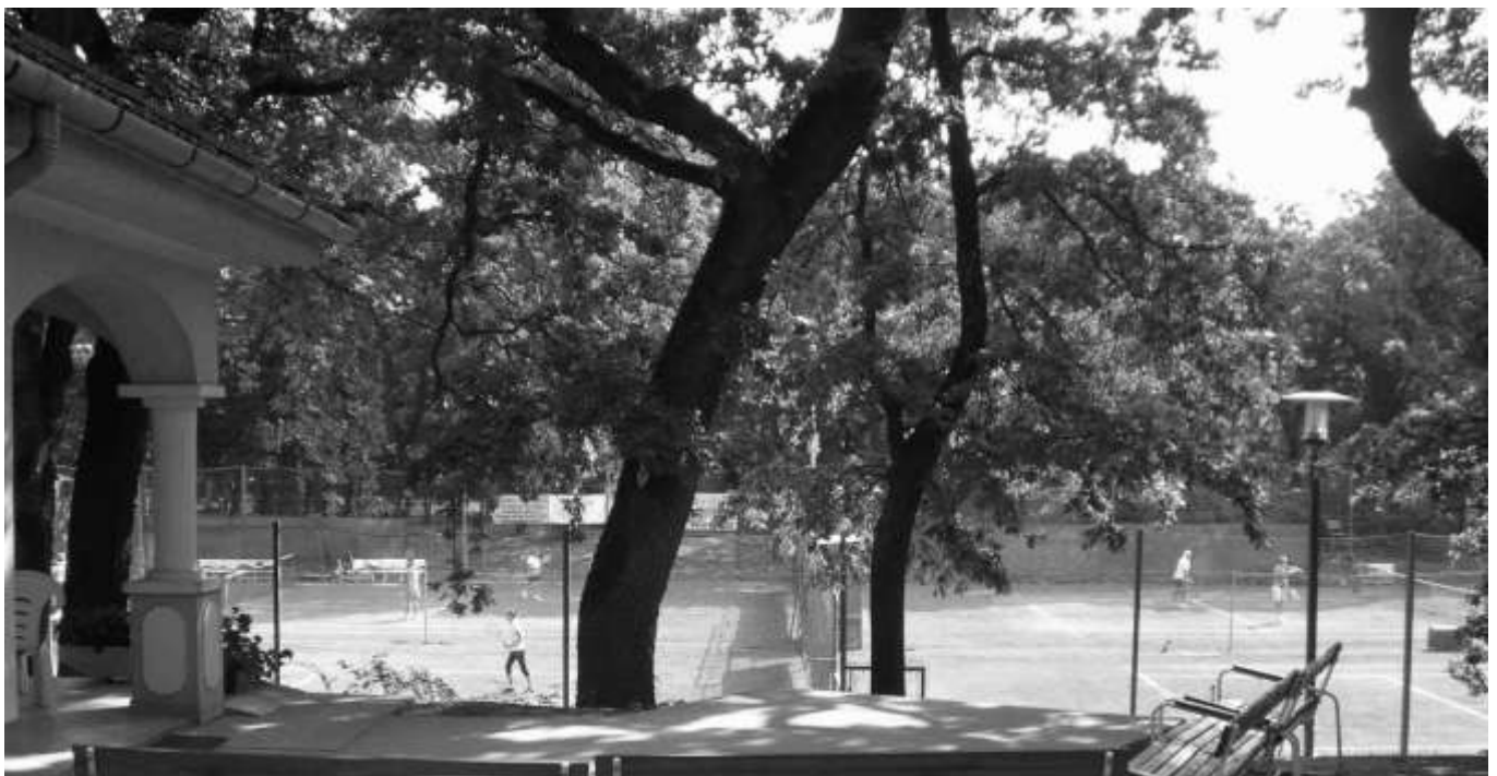
A tenispályák 2013 júliusában