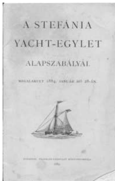
A Stefánia Yacht-Egylet 1889-es alapszabálya