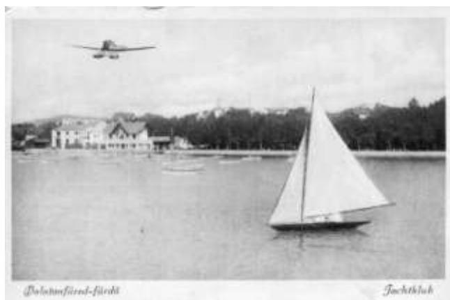
Képeslap 1925-ből

mogyi dombok. Földvarról kevés időzés után Siófokra vettük az utunkat. Ezen az úton értük el a legnagyobb magasságot. Alattunk a földön kis százlábú ballagott, a gyorsvonat. Itt-amott egy-egy alig mozduló pontocska valószínűleg kocsi. Alig telt el 5 perc és a mélyben egy zöld ellipszis tűnt fel, lehetetlenség, a siófoki lóversenytér felett szálunk. Alig hogy ezt elgondoltam, már a siófoki strandfürdő fölött zúg a gép, mind lejjebb-lejjebb ereszkedve. Lent a vízben, mint a vízbe sodrott őszi falevelek imbolyognak a hervadó levelek színvariációban a fürdődresszek. Egy éles kanyarulat, Siófok felett, és mint egy vízre szomjas sirály a Balatonra száll lágyan, észrevétlen a hidroplán. Vége lett az álomnak, az ábrándozásoknak, a gyönyörű élő filmnek.”