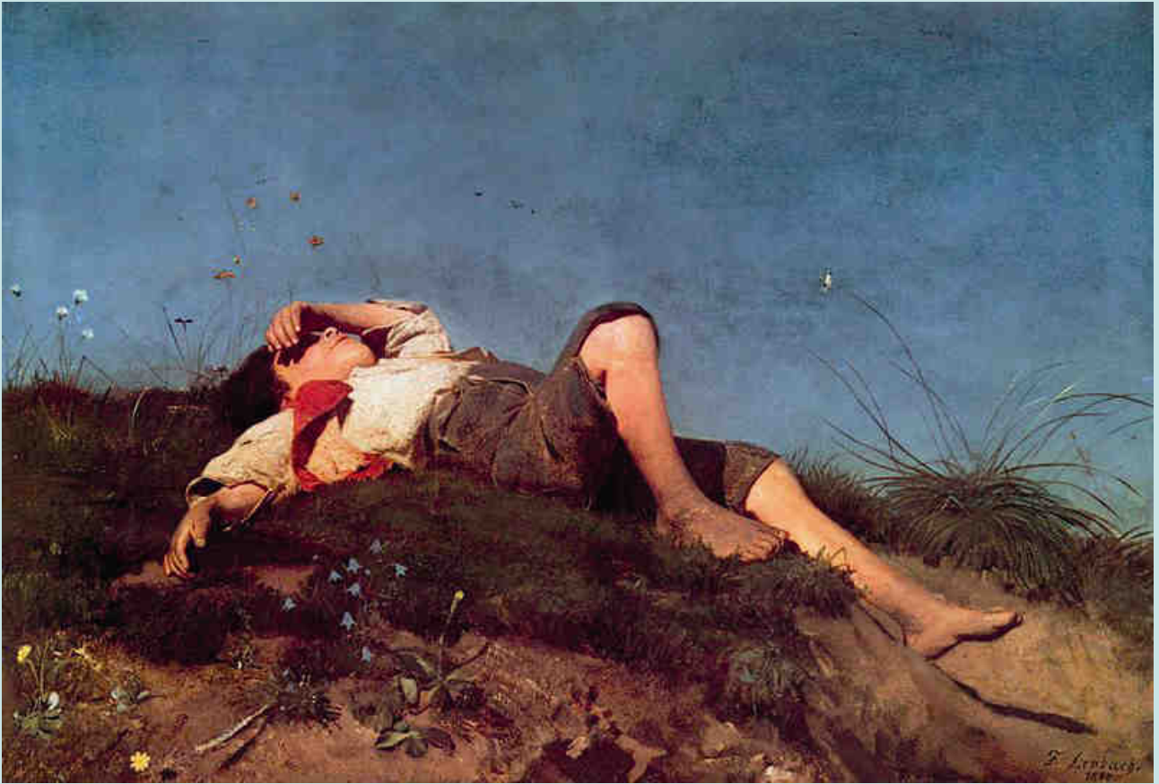
Franz von Lenbach: Pásztorfiú (Hirtenknabe) (1859–1860) (München, Schack Galerie)