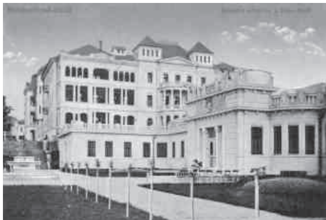
A füredi szanatórium