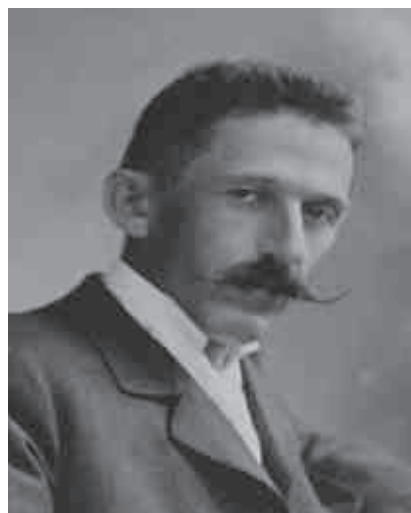
Gárdonyi Géza (1863–1922)