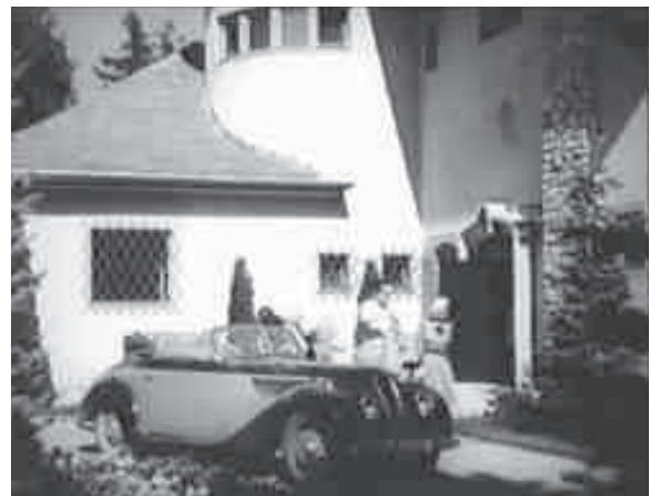
A Brázay-villa 1943-ban (részlet a „Fény és árnyék” című filmből)