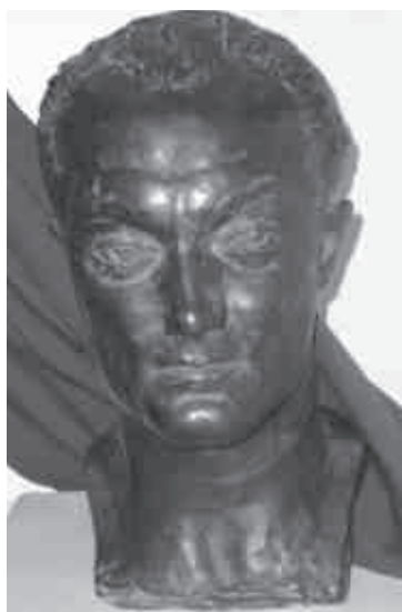
Ferencsik János (1907–1984)

A Klotild- és Erzsébet-udvar átépítésével, valamint az új, földszintes fürdőépület (Tibor-fürdő) kialakításával létrejött az egész évben működő szanatórium és szálloda, a mai szívkórház épületegyüttese. Say Ferenc tervei alapján 1912 októberében kezdték el építeni, 1913 nyarán már fogadott vendégeket. (Bővebben: Némethné Rácz Lídia: Balatonfüred nevezetes épületei. Balatonfüred, 2008. 33–39.)