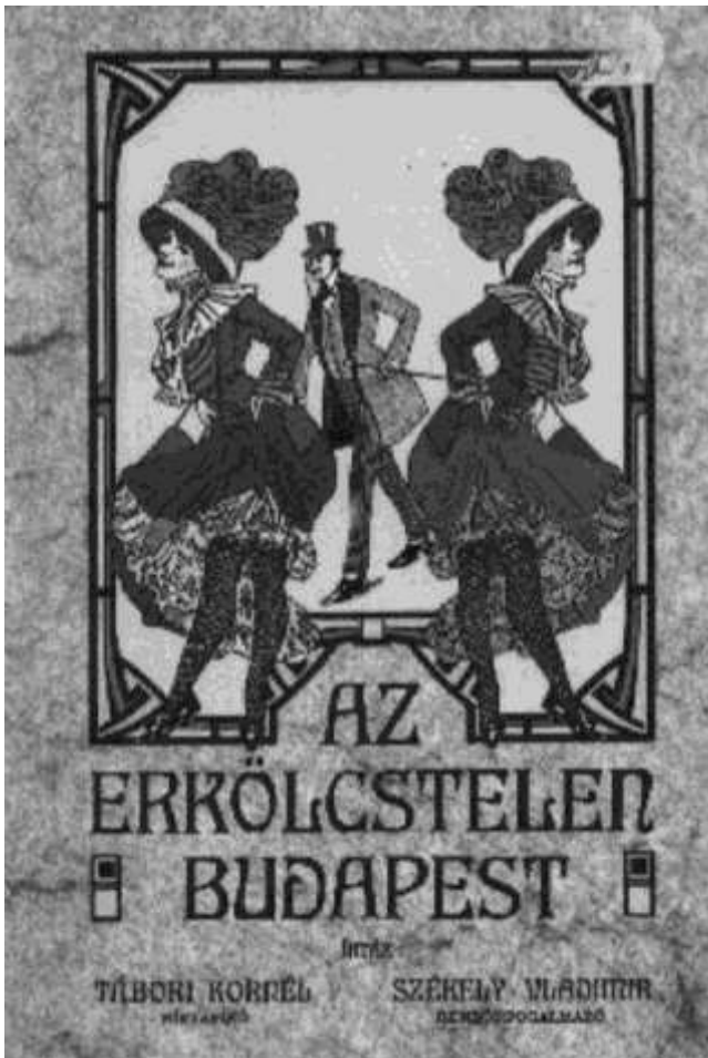
1909-ben megjelent munkájának címlapja

tatásaikat diszkréten még az újságokban is meghir- detik, vagy a szerencsétlenségükre mégis megszü- letett gyermekek jobb létre szenderítésében segéd- kező falusi dajkák mind a prostituáltak ki- és eltar- tottai. A prostitúció okozta problémák megoldását is jó irányban kereste: olyan szabályozást javasolt, amellyel a kéjnéket jobban lehetne ellenőrizni, egyszersmind erőteljesen visszaszorítani a prostitu- cióhoz kapcsolódó bűnözést.