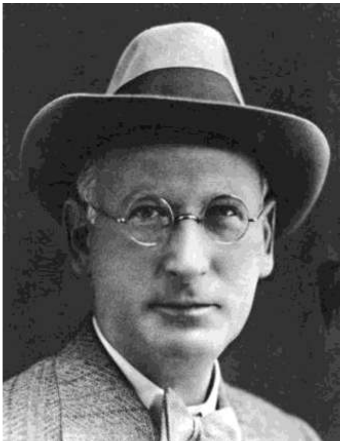
Tábóri Kornél 1920-ban

Az 1879-ben született Tábóri Kornél azok közé tartozik, akiket az utókor „méltatlanul elfelejtett”-ként szokott emlegetni. Sokszorosan megérdemelné pedig, hogy számon tartsuk.