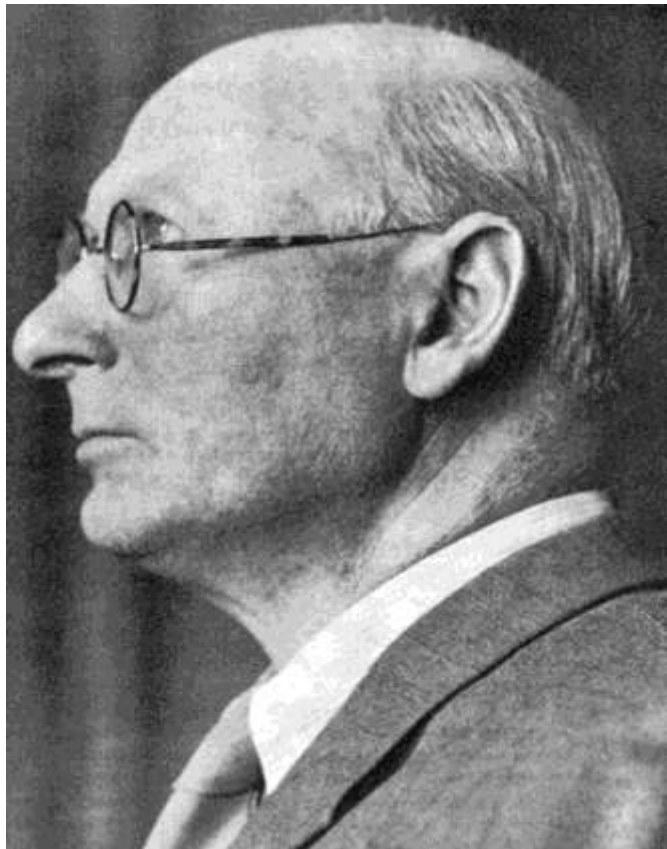
Tábori Kornél idős korában

tő jelzés, a sárga csillag viselése; telefonjaikat kikapcsolatják, rádió-készülékeiket elkobozzák. Április 7. után írásos engedély nélkül tilos bárhová utazniuk, és országszerte megkezdik a gettók felállítását.