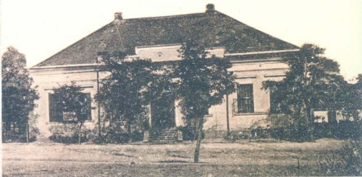
A járásbíróság épülete egykor...