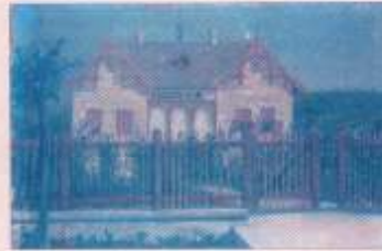
A Szent Anna-templom (1876-1878)