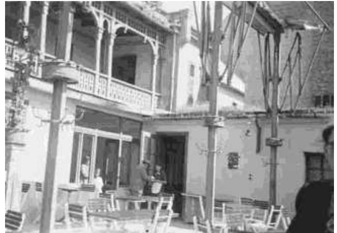
A cukrászda terasza