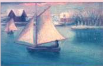
Paradisejéi (1900) - Füred és a Balaton (1900-1900)