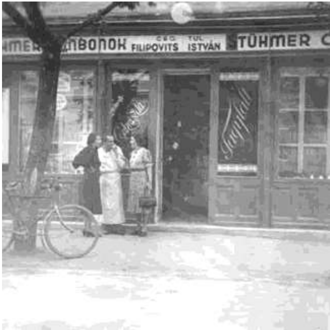
A cukrászda az utca felől