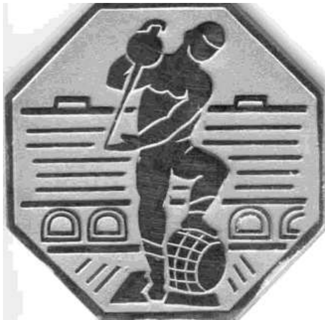
A plakett hátlapja

ték ki. A hét folyamán a résztvevőkre kemény megmérettetés várt, végül 7-én, pénteken fejeződött be a XIV. országos borverseny. A 840 beküldött bormintából a bírálóbizottság 268-at arany, 455-öt ezüst, 89-et bronzéremmel és 9-et oklevéllel jutalmazott. A díjak kiosztására csak később, a tapasztalatok összegezése, a szakmai értékelés után került sor.