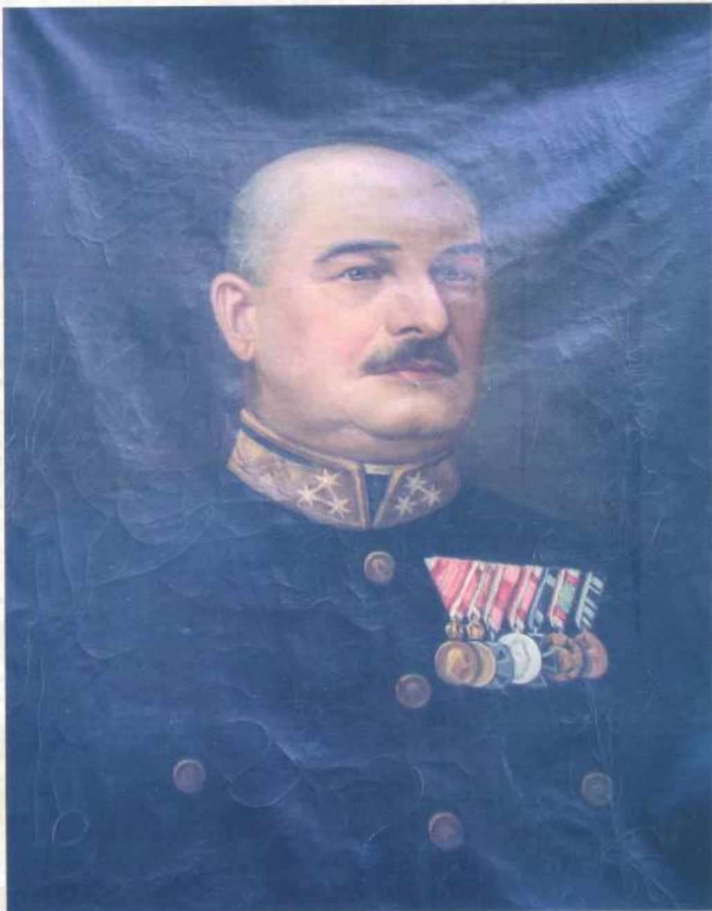
Protiwinsky Ferenc: Ránzay Ágoston portréja