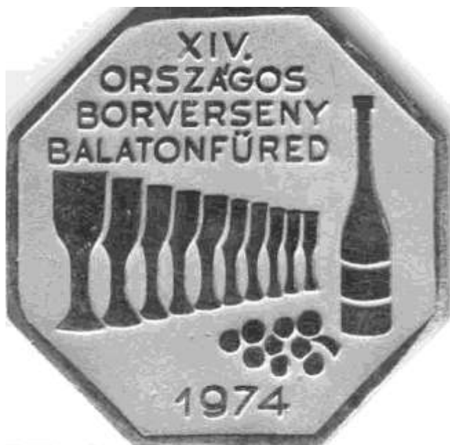
A plakett előlapja

A nyár elején egy árverésen a gyűjteménynek sikerült megszereznie az 1974-ben, Balatonfüreden rendezett XIV. országos borverseny plakettjét, amely nyolcszögletű, 6 cm-es átmérőjű, ötvözetből készült. Tervezőjének/készítőjének eddig sajnos nem sikerült nyomára akadni.