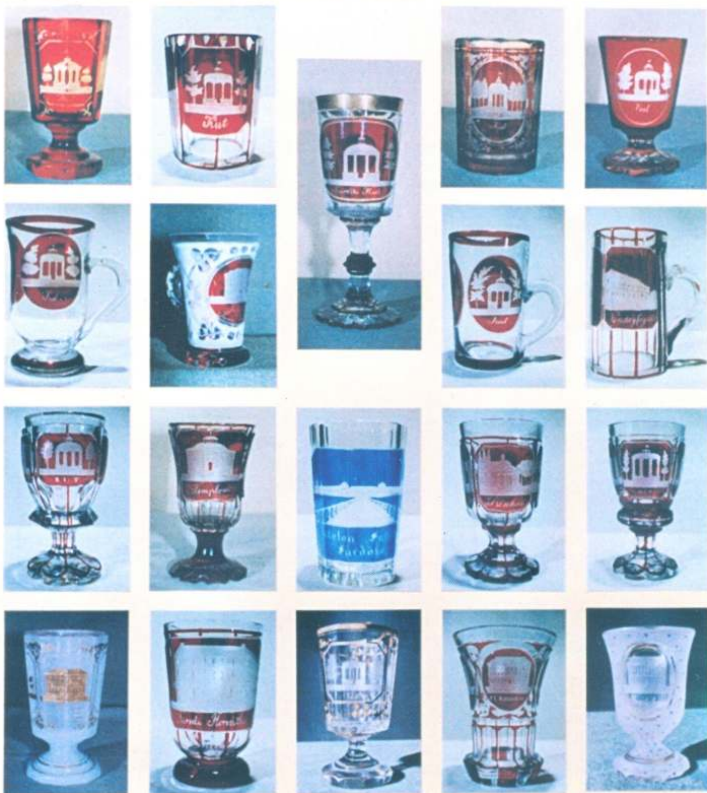
Balaton-Füred fürdő ivókúra poharai (Tablókép a Helytörténeti Gyűjteményben)