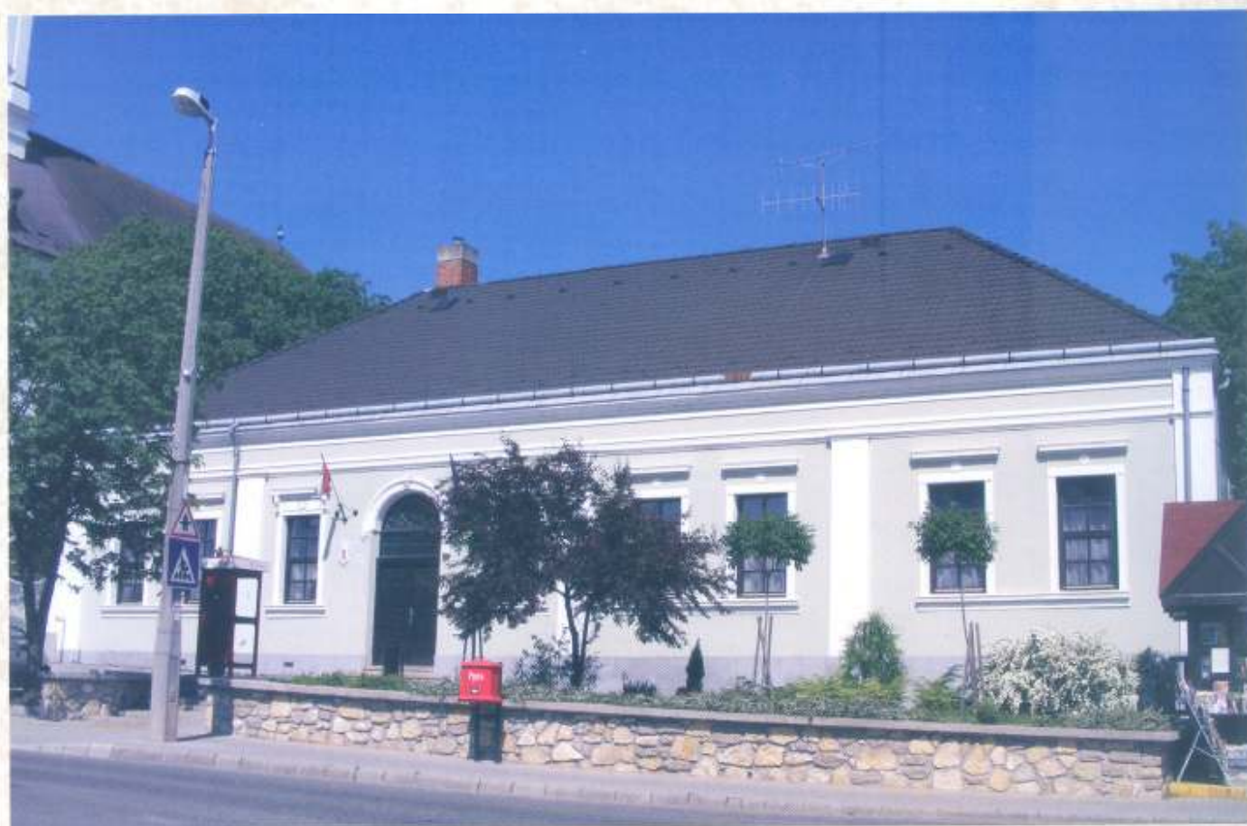
...és ma mint óvoda