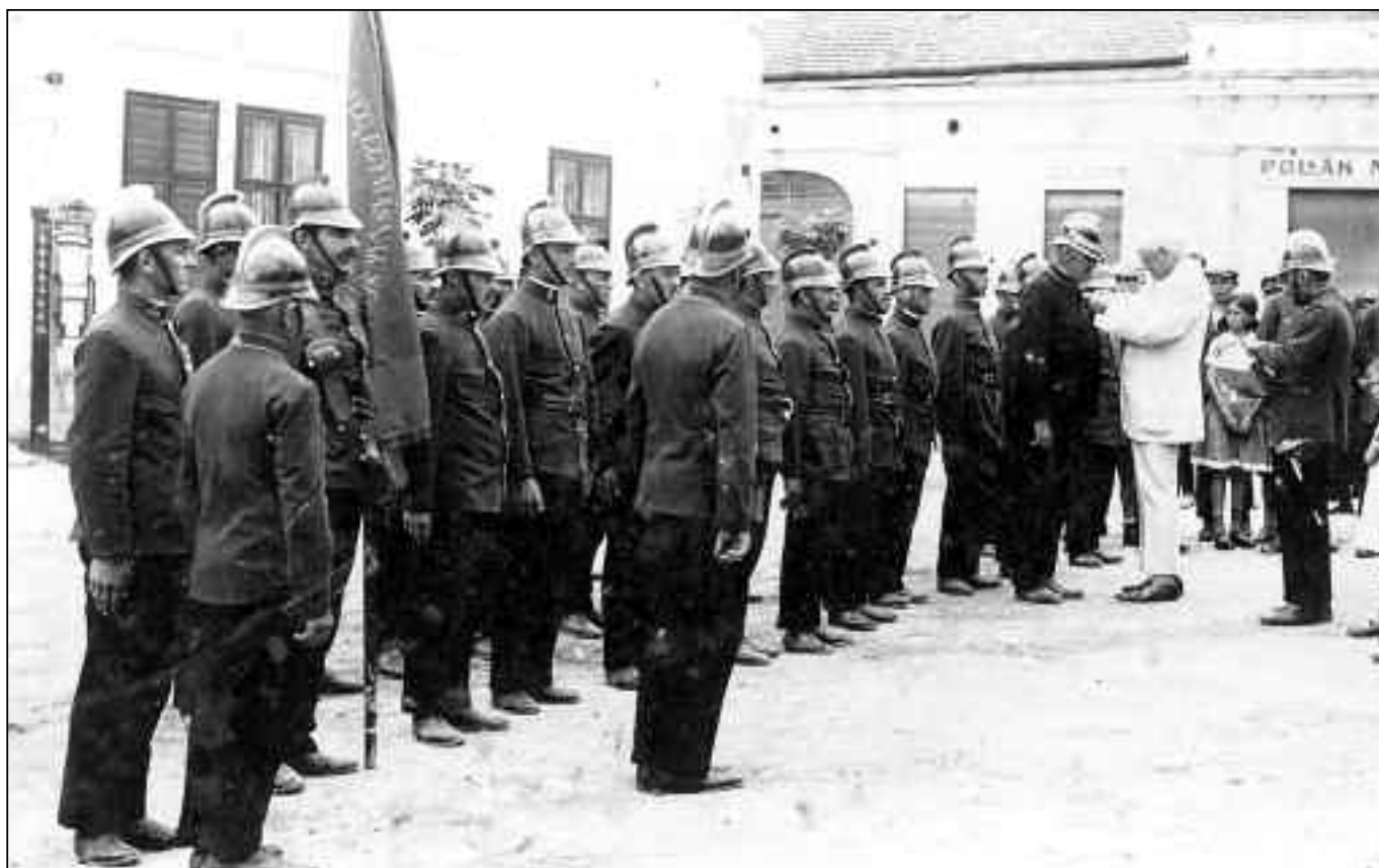
Az 1881-ben alakult Önkéntes Tűzoltóegylet tagjai az 1930-as években