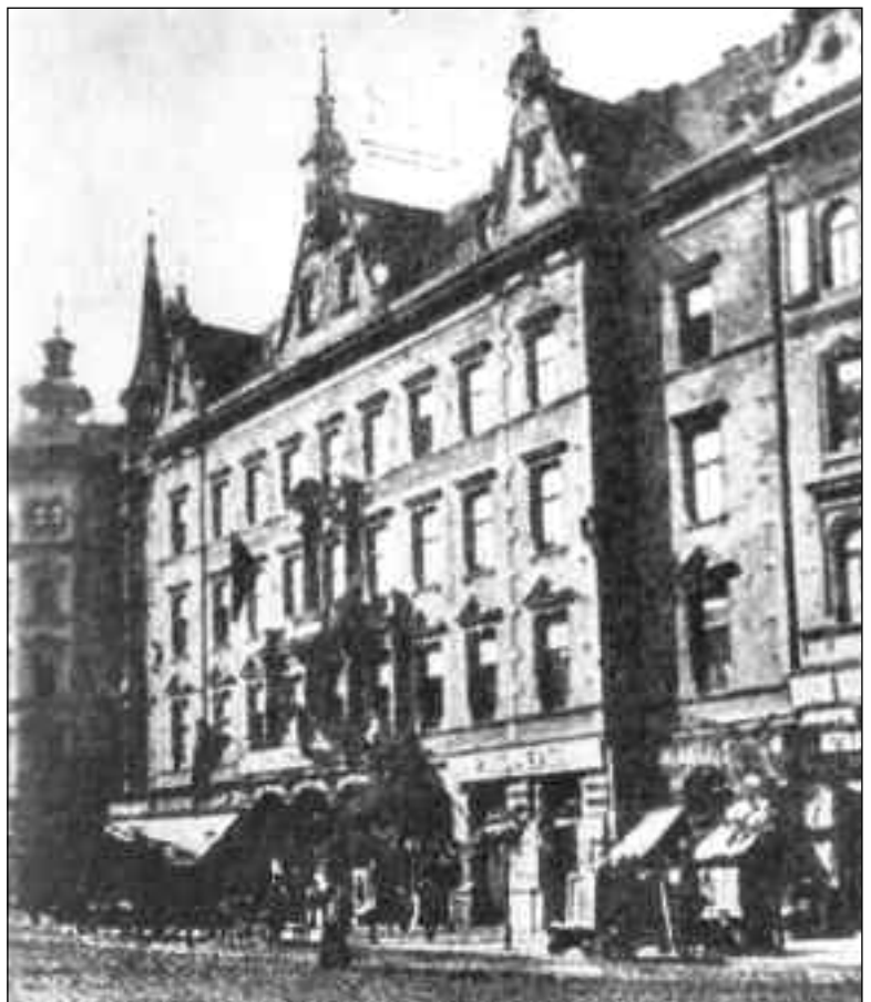
Jókai utolsó lakása Budapesten

Halála után, 1904. május 18-án közli a Budapesti Napló Jókai Mór a szegény sorsúakat gyógyító tüdőbeteg szanatórium érdekében írt sorait: „Emberirtő vész fenyegeti nemzetünket, az egyre elhatalmasodó tüdővész (...) az egész társadalomnak föl kell buzdulni a vész sikerteljes leküzdésére, amely már a