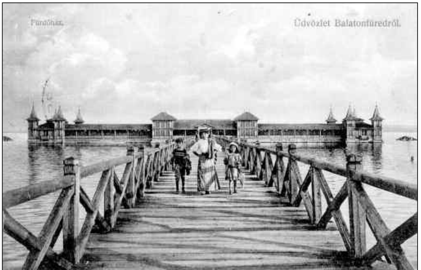
A balatonfüredi fürdőház látképe