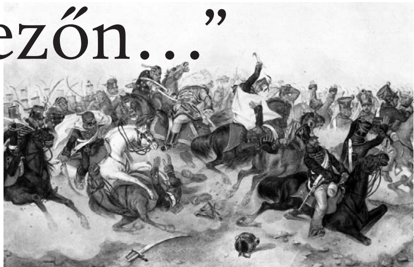
THAN MOR FESTIMENE A TAPROBICEK CSANTAROL