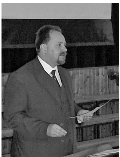
Adorjáni Dezső Zoltán erdélyi püspök előadás közben

Az elmúlt öt év összegyűjtött adataival Andorka Árpád statisztikus, a kerület másodfőügyelője szembesítette a résztvevőket. Elmondta, hogy a statisztikák nem sok optimizmusra adnak okot. A Déli Egyházkerületben is megfigyelhető az ország egészére jellemző tendencia: folyamatosan csökken a népesség. Az elmúlt öt év során a kerületben is több embert temettek el, mint ahányat megkezeszteltek. Ezenkívül – a népszámlálási adatokhoz képest – a gyülekezeti választói névjegyzékek sokkal kevesebb embert tartalmaznak. Természetesen ezekben az adatokban is vannak eltérések az egyes egyházmegegyezések között, de a tendencia mindenhol ugyanaz. A legmeglepőbb az egyháztagnak által a gyülekezetekhez eljuttatott pénzbeli támogatások mértékéről szóló adat volt. A számok tanúsága szerint egy ember öt év átlagában egyházfenntartói járulék címén közel