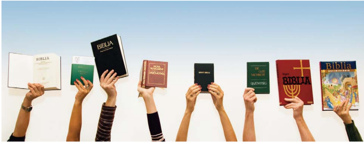
Bibliavasárnap – írásaink a 10. oldalon

Istenhez kötődő csoda ▶ 7. oldal Október: igék megtartó mécsvilága ▶ 10. oldal Lehetne akár a mi papunk is... ▶ 7. oldal Lehet-e profitorientált a gyógyítás? ▶ 13. oldal Mosolygós hétfő reggelt! ▶ 11. oldal Képeslapok Győrből ▶ 8–9. oldal