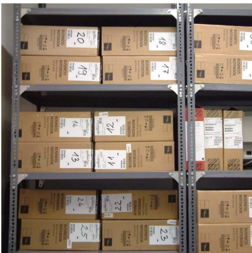
Pályázaton nyert notebookok bevetésre várnak

A plakáton olvasható iskolánk második sikeres Humán erőforrás-fejlesztési operatív program (HEFOP) pályázata. A kompetenciaalapú oktatási programok megvalósításához 9,5 millió Ft-ot nyertünk eszközök beszerzésére. Az elnyert összeg lehetővé tette, hogy interaktív oktatói anyagokat, kompetenciafejlesztő eszköztárat, taneszközöket, hordozható számítógépeket, multimédiás nyelvoktató CD-ket, vizsgatesztelő szoftvereket vásároljunk. A pályázatnak köszönhetően idegen nyelvű kompetenciát fejlesztő nyelvi labort is kialakíthattunk.