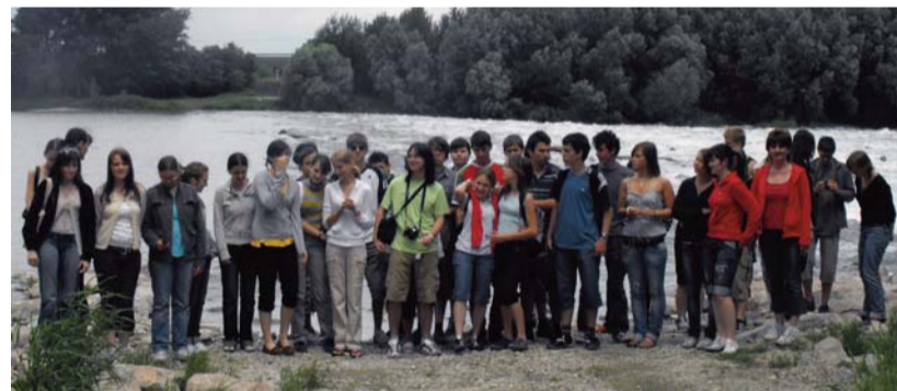
Látogatás a bős–dunakiliti vízerőműnél

Iskolai közösségünk a szervezéssel és vendéglátással járó feladatokat szeretettel, örömmel és fegyelmezetten hajtotta végre. Az EGOT tovább erősítette bennünk az együvé tartozás jó érzését. A találkozó résztvevőitől rengeteg jó szót, hálás köszönetet kapunk még ma is. Ezekből idézünk a találkozó mottójának szellemében: „Örömmel sokszorozódjék a te örömödben, hiányosságom váljék jósággá benned.” (Weöres Sándor) (A levélrészletek ezen az oldalon keretben olvashatók. – A szerk.)