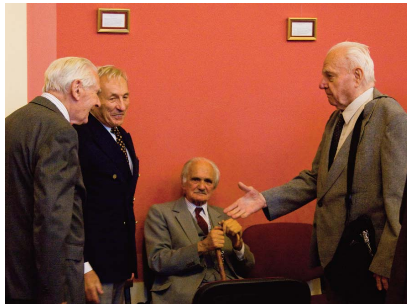
Fasori öregdiákok az október 3-ai ünnepség utáni fogadáson

Véleményem szerint egy ilyen nagy horderejű mozgalom (az egyházi iskolák egy részének visszaadása) több parallel szinten játszódik le. Mindez csak egy adott történelmi pillanatban lehetséges, és ezért indították el a Fasor régi diákjai kihasznál-