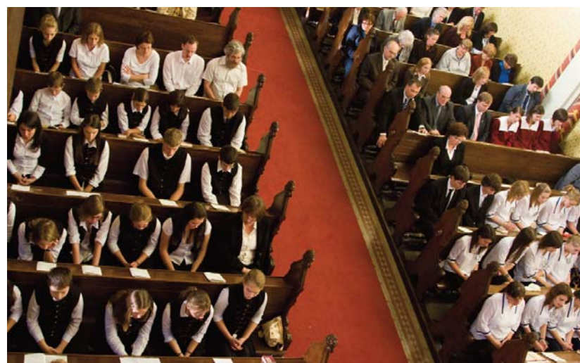
LUKÁCS GÁBI FELVÉTELEI

Az iskola felvételije mentes a formáságotól: a tanári kar maga felvételizeti a gyermekeket, elbeszélget velük, elsősorban képességeiket vizsgálja, nem pedig a bizonyítvány alapján dönt. A tanári közösség választja az igazgatót, de a döntés fölött ott áll az iskolafenntartó – ez esetben egyházi – közösség vótuma is, a szülők képviselete is. Szigorú követelmények még a tanárokkal szemben is. A felekezeti vonatkozásban a teljes tolerancia. Vajon nem olyan iskolaszervezési jegyek ezek, amelyekből világi iskoláink meríthetnek? S amikor visszagondolok mint kutató az iskola volt neves diákjainak levelezésére, csak reménykedem mint miniszter; hogy a diák- és tanárközösségi régi formák is újralednek e falak között: az ifjúsági segélyegylet, amely maga döntött a szociális jogosultságról, a tanárok és diákok közös dal- és zeneegylete, az önképzőkörök és nem utolsósorban a diáksportkör. Színes otthon, kibontakozási lehetőséget nyújtva munkánk értelmének, egy nálunk jobb generáció felnövésének. És kívánhat-e többet egy tanár az 1989/1990-es tanév megnyitóján?