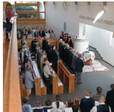
„Búcsú-istentisztelet” a református templomban