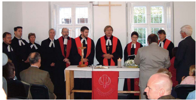
Az imaterem birtokbavétele