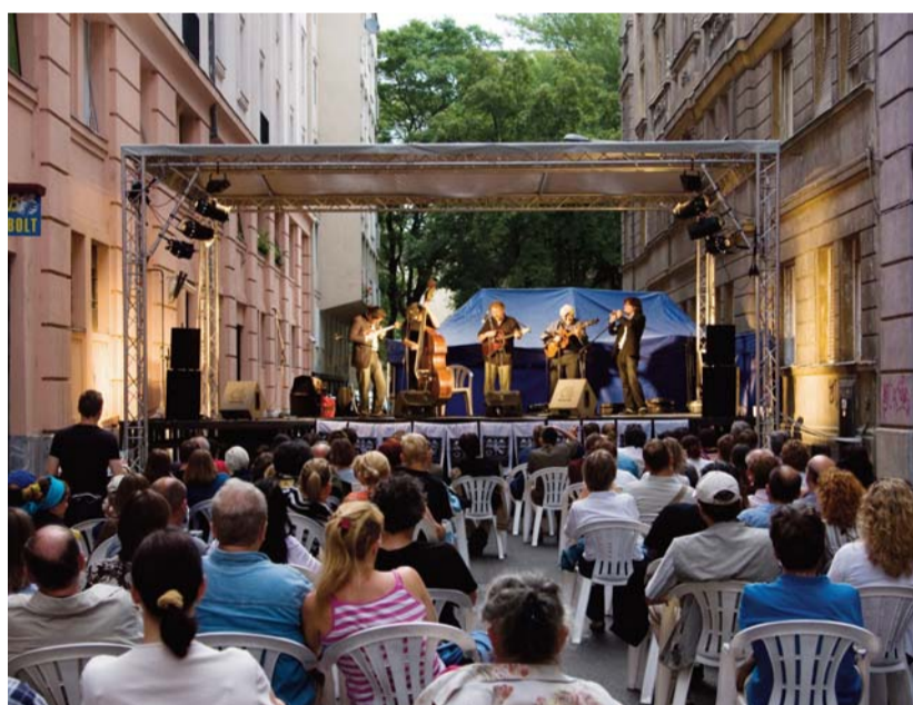
A színpadon a Vujicsics együttes

„Megőrizni, megmutatni református zenei kincsünket, kultúránkat a jelen és az utókor számára” – fogalmazták meg újra a szervezők a június 5–7. között megrendezett hatodik fesztivál célját. Budapest-Ferencvárosnak a Ráday és a Kinizsi utca által határolt részén, a „Kultuccában” zsolnárok, tradicionális egy-