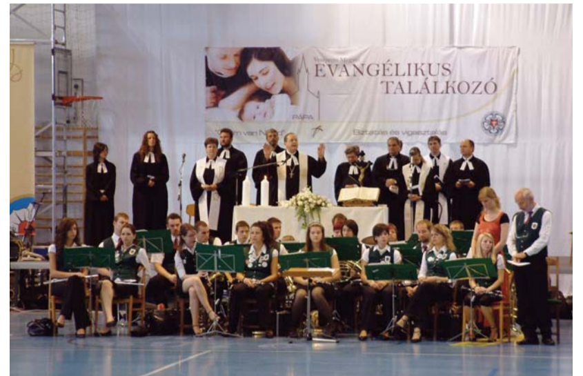
Pódiumon az egyházmegye lelkészei – előtérben a téti fúvósok

vászpatonai egyházközséget testvérkapcsolat fűzi a szlovéniai Domonkosfa és Pártosfalva gyülekezeteihez, a testvérek idei viszontlátogatását pedig éppen erre a vasárnapra időzítették. Így mintegy ötven fővel