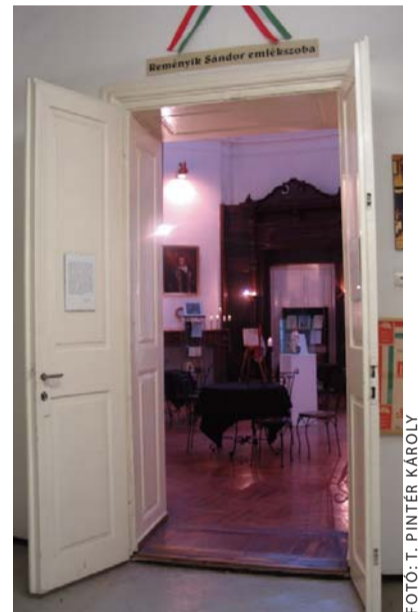
Reményik-emlékszoba a várpalotai Trianon Múzeumban