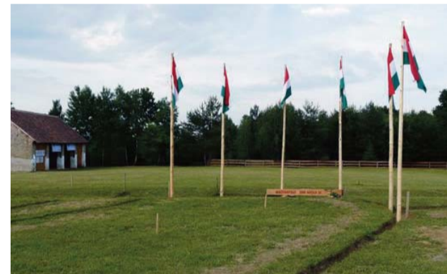
A templom kijelölt helye és az alapfa

– Mit üzenhet Magyarföld falu története Magyarföldnek, az országnak?