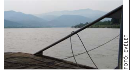
A Duna is egyre szennyezettebb...

Mi történt? A média feladata lenne a trágárság legalizálása?