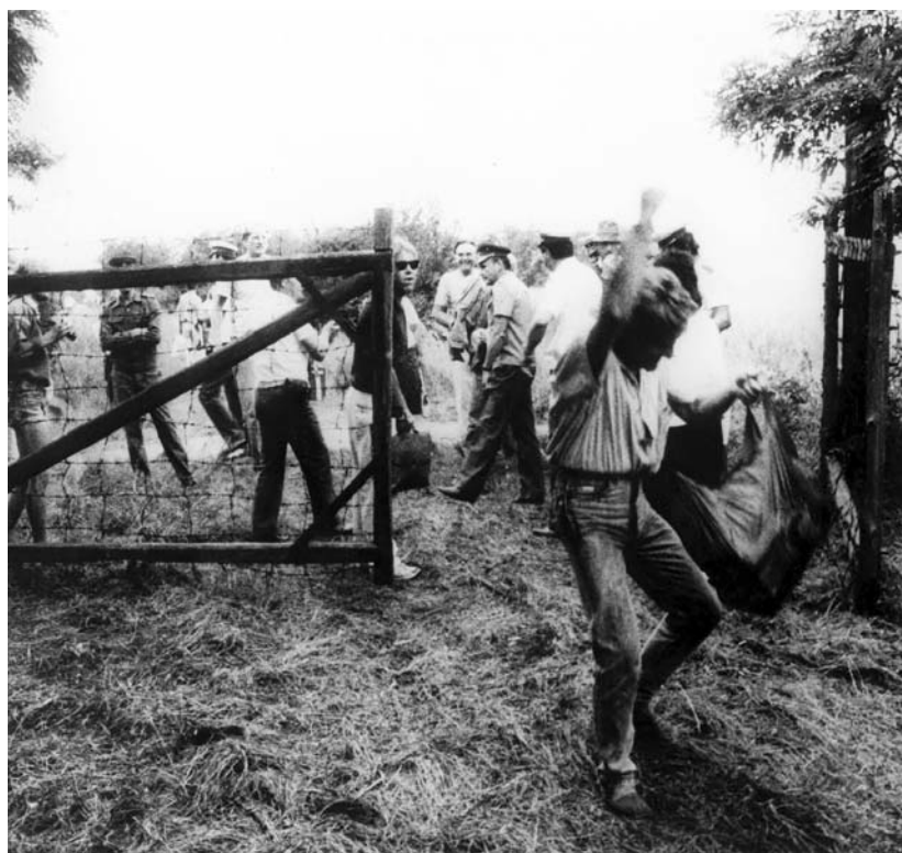
Grenzöffnung 1989: Während des „Paneuropäischen Picknicks“ durchbrechen DDR-Flüchtlinge die ungarisch-österreichische Grenze, 19.8.1989

Zwanzig Jahre nach der Wende frage ich mich immer noch, wie diese Teilung überwunden wurde. Es gibt keine großen Helden für diese Revolution, auch wenn kluge Politiker sicherlich viel dazu beigetragen haben, dass es nicht zu einem Blutvergießen kam. Vielleicht waren es tatsächlich die Menschen, die bis an die Grenze gingen, bis an die Grenze des Erlaubten und einen Schritt darüber hinaus, in Sopron oder bei den Friedensgebeten in der Leipziger Nikolaikirche, in der Prager Botschaft und an der Mauer in Berlin. Nicht eine politische Ideologie spornte sie an und nicht der Hunger nach Revolution, sondern die Unzufriedenheit mit den ungerechten