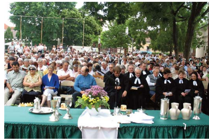
Készülődés a záró úrvacsorás istentiszteletre