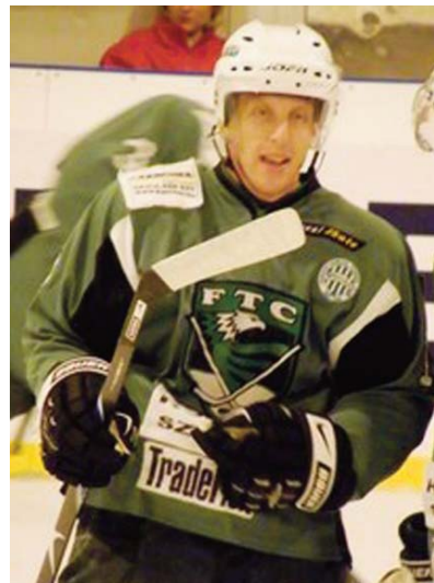
A Ferencváros színeiben

– Négy-öt évig játszottam az NSZE együttesében, de ott megszűnt az én korosztályom. Bár az egész családom erősen Fradi-szimpatizáns volt, tudatosan választottam az Újpestet. Aztán amikor a csapatban különféle gondok jelentkeztek, akkor hívtak