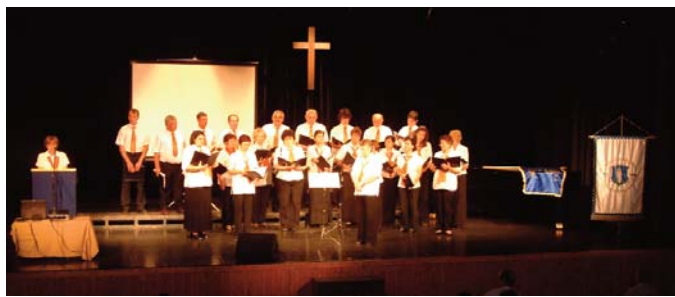
Az oroszországi evangélikus énekkar

tünk. Vagy gazdasági, vagy ökológiai válság uralkodik el rajtunk. A kultúra eredendően azt jelentette, hogy a világot művelni kell, átszellemülten Istenhez emelni. A reneszánsztól kezdve aztán kialakult egy új világ, amelyből Isten hiányzik – fejtette ki. Az Antikrisztus nem tud megtestesülni, hanem rajtunk keresztül cselekszik. „Ha nincs Isten, akkor bankokat és tankokat kell építeni” – gondolta az ember. Őriási technikai fejlődés indult meg a volt keresztény Európában. Magas szinten elégitik ki az emberiség alacsony szintű igényeit. Az előadó megállapítása szerint az életszínvonal megszűntette a lélekszínvonalat.