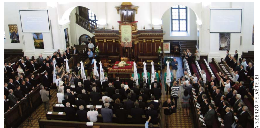
Az alkotmányozó zsinat a debreceni Nagytemplomban

tusok Világszövetsége, az Európai Egyházak Konferenciája és több testvéregyház, valamint az egységesülést kezdettől szorgalmazó Tőkés László , a Királyhágó-melléki Református Egyházkerület püspöke, aki jelenleg az Európai Unió „parlamentereként” küzd hasonló célokért. Korántsem lényegtelen, hogy Kirill , Moszkva és egész Oroszország pátriárkája is üdvözölte a magyar reformátusság egységét. A romániai ortodoxiára is befolyással bíró egyházi vezető levelében azt írta a reformátusok újraegyesítésének kapcsán, hogy az „újabb erőt ad a keresztények között-