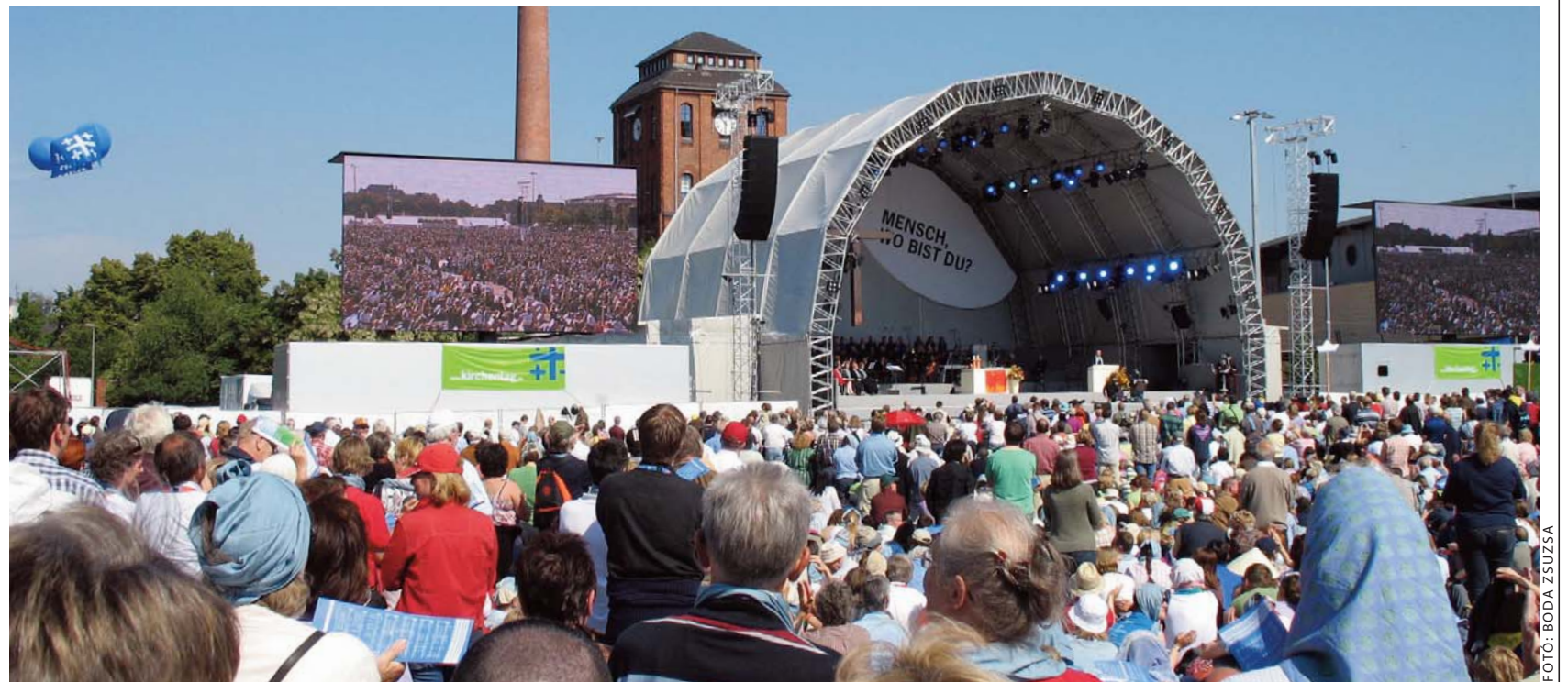
A záró istentisztelet – a kivetítőkön éppen a tömeget pásztázó kamera képe