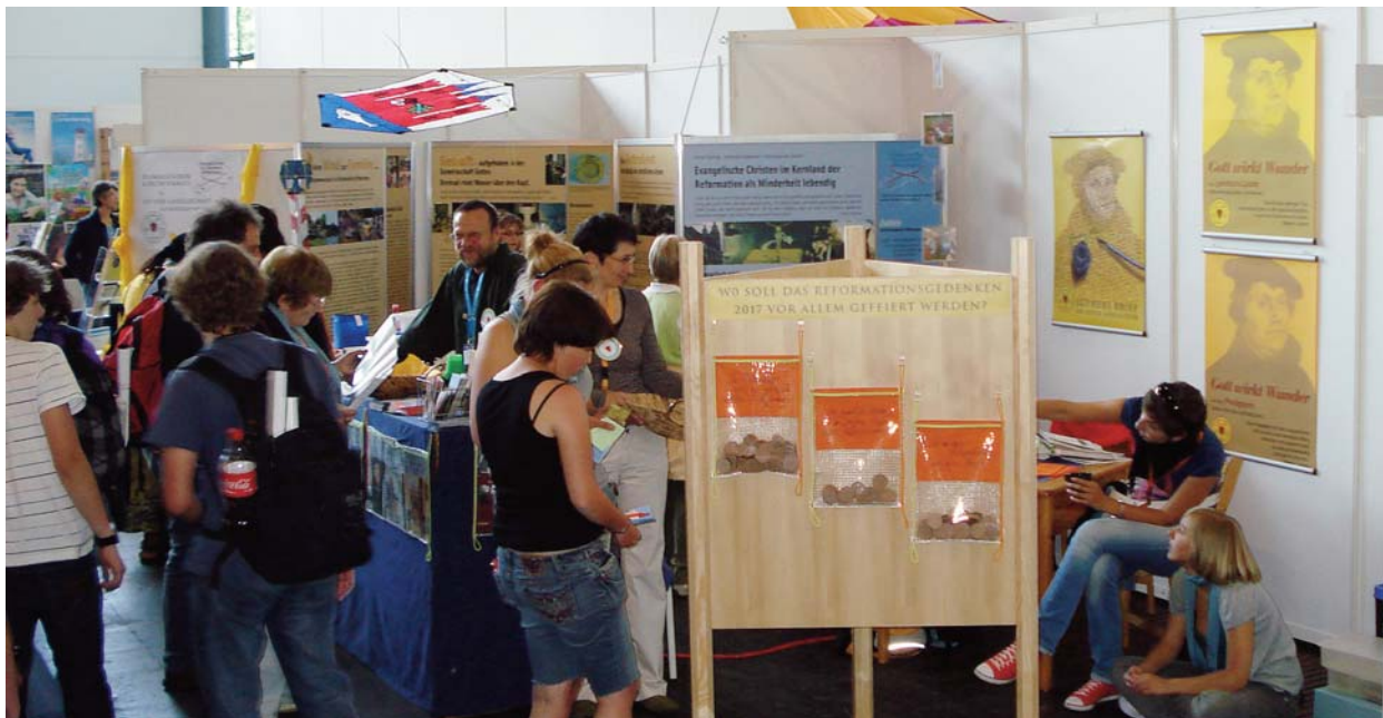
Szavazategyűjtő zacskók a wittenbergiek standjánál