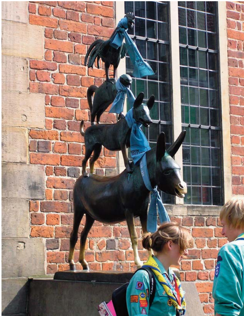
A brémai muzikusok is a Kirchentag kendőjét viselték a nyakukon

„Itt!” – hangzott a kiáltás egyszerre százezer torokból. Ez a rövid szócska (volt) a válasz az idei Kirchentag mottójára. A május 20. és 24. között Brémában megtartott 32. német evangélikus egyházi napok záró istentiszteletén erre a bizonyos „Ember, hol vagy?” (vö. 1MÓZ 3,9) kérdésre zengett a felelet.