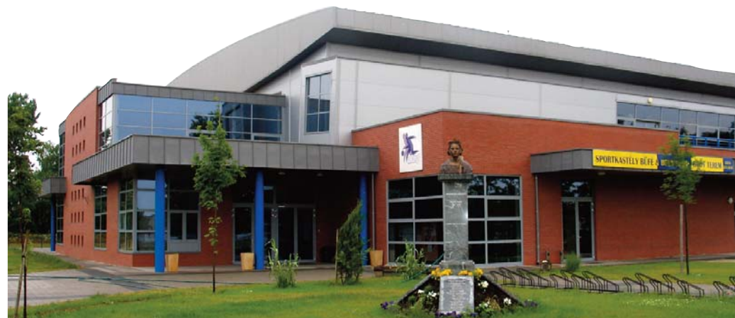
A szeptember 12-i evangélikus presbiteri találkozó majdani helyszíne Pestszentimrén

Örömmel olvastam például lapunk március 8-i számában a február 27-i révfülöpi „presbiteri továbbképzésről” szóló beszámolót, az egyik ott elhangzott előadást, valamint a március 15-i számban Gáncs Péternek a „püspök szemével” írt – szintén Révfülöpon előadott – helyzetképét a presbiteri szolgálatról. Számos értékes gondolatot találhattunk arról is, hogy a püspökön kívül négy lelkész és az országos iroda két vezetője tartott a témával kapcsolatos előadást, illetve adott szakmai kérdésekben útmutatást. Az oldalt külön ünnepélyessé tette a Nyílt levél evangélikus presbitertársainkhoz című