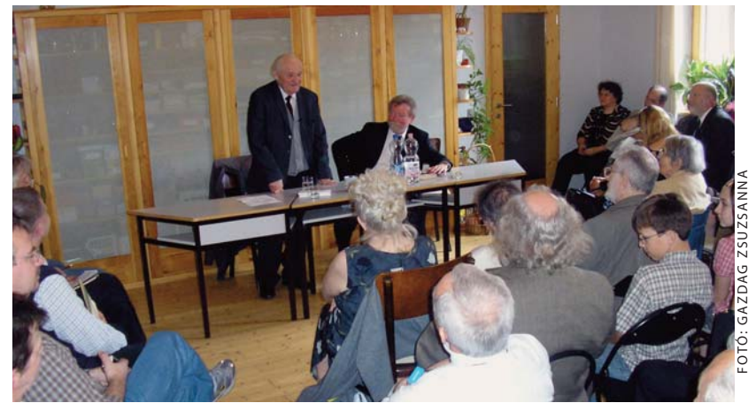
Kányádi Sándor: „Én nem szegény erdélyi menekült vagyok, hanem diplomata”

A békási közösségben minden hónap harmadik vasárnapja az az alkalom, amikor az istentisztelet után az egyházközség tagjai közös ebéden, majd