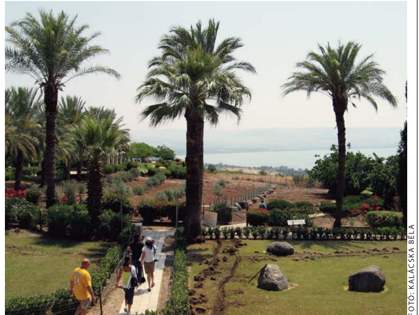
A boldogmondások hegyoldalán

regély István érsek, sőt a szabadegyházak küldötte is. Itt jegyzem meg, hogy bár az 1991. július 18-án államilag regisztrált egyházas-kulturális civil szervezetté nyilvánított Ökumenikus Tanulmányi Központ nem utazási iroda, alapszabálya ugyanakkor lehetővé teszi zarándokutak szervezését. Az isteni gondviselés mindvégig gondoskodott hozzáférő és mélyen hívó érdeklődőkről, így a kezdetben nagy kétséggel fogadott elgondolás életképesnek bizonyult, és változatlanul az mai napig.