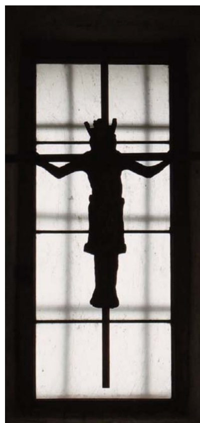
A TÍHANYI APÁSÁG ALTEMPLOMÁNAK EGYIK ABLAKÁRÓL

A számos egyházzenei feldolgozás közül kiemelkednek Johann Sebastian Bach (1685–1750) művei. A Máté-passió vezérkoráljaként újra és újra oda mutat a keresztre. Mégis, Bach teológiaiának számomra megdöbbentő momentuma, mikor a Karácsonyi oratórium első kantatájának ötödik koráljában, az ad-