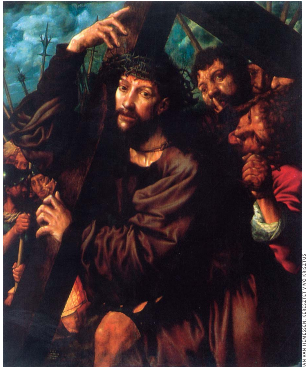
JAN VAN HEMESSEN: KERESZTET VIVÓ KRISZTUS

Keresztet vivő Jézus – nagyon sokszor ábrázolták már. Megkínzott, szenvedő arc, töviskorona alól aláhulló vércseppek – legtöbbször így látjuk. De 1553-ban Jan van Hemessen egész különlegesen festette meg a Golgota felé menő Megváltót: Jézus sír. Nem a kegyetlen katonák miatt – nem rájuk néz, nem az őt gúnyoló tömeg miatt – nem rájuk néz, hanem miattam, aki szemben állok a festménnyel. Rám néz, és engem sirat, miközben vállalja értem a kereszthalált. De nem itt fejeződik be nagypéntek, hiszen annyira szerette az embert minden bűne ellenére is, hogy még a poklokra is alászállt. Krisztusnak oda is van hatalma és ereje elmenni, amely helyre én csak rettegve gondolkodom.