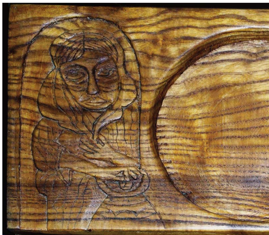
RADICS BÉLA: SZEGÉNY ASSZONY KÉT FILLERE (PERSENTYÁNYÉR, GALGATYÓKI EVANGÉLIKUS TEMPLOM)

Ó, Uram! Amikor ott ülök életem perselyeinél, és látod, mit adok abból, amim van, akkor pontosan tudod, hogy milyen sokszor én is csak a fölöslegből adok. Milyen sokszor elfelejtkezem arról, hogy semmim sem lenne, ha nem kapnék tőled erőt és segítséget földi céljaim és sikereim eléréséhez. És én úgy hálálom ezt meg, hogy előbb mérlegre teszem a pénzemet, az időmet és a lehetőségeimet, majd csak annyit áldozok belőlük az ügyedre, amennyit épp nem sajnálok. Bocsáss meg érte!