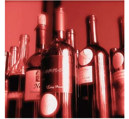
87-féle bort bíráltak

eljöjjön, hisz maga helyett munkást kell fogadnia – mégsem tudja megtenni, hogy otthon maradjon, mert Révfülöp nélkül nem telhet el egy év.