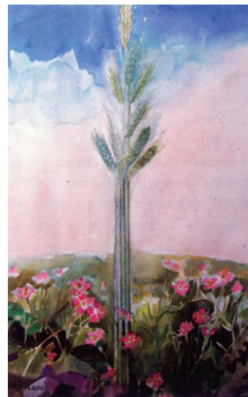
BRADA TIBOR: A BÚZA ÉS A KONKOLY

Más helyen így tanított Jézus: „Hasonló a mennyek országa ahhoz az emberhez, aki jó magot vetett a szántóföldjébe. De amíg az emberek aludtak, eljött az ellensége, konkolyt vetett a búza közé, és elment. Amikor a zöld vetés szárra szökött, és már magot hozott, megmutatkozott a konkoly is. A szolgák ekkor odamentek a gazdához, és azt kérdezték tőle: Uram, ugye jó magot vetted a földedbe? Honnan van akkor benne konkoly? Ellenség tette ezt! – felelte nekik. A szolgák erre megkérdezték: Akarod-e, hogy kimenjünk, és összeszedjük a konkolyt? Ő azonban így válaszolt: Nem, mert amíg a konkolyt szednétek, kiszaggatnátok vele együtt a búzát is. Hadd nőjön együtt mind a kettő az aratásig, és az aratás idején megmondom az aratóknak: Szedjétek össze először a konkolyt, kössétek kévébe, és égessétek el, a búzát pedig takarítsátok be csűrőmbé.” (Mt 13,24–30)