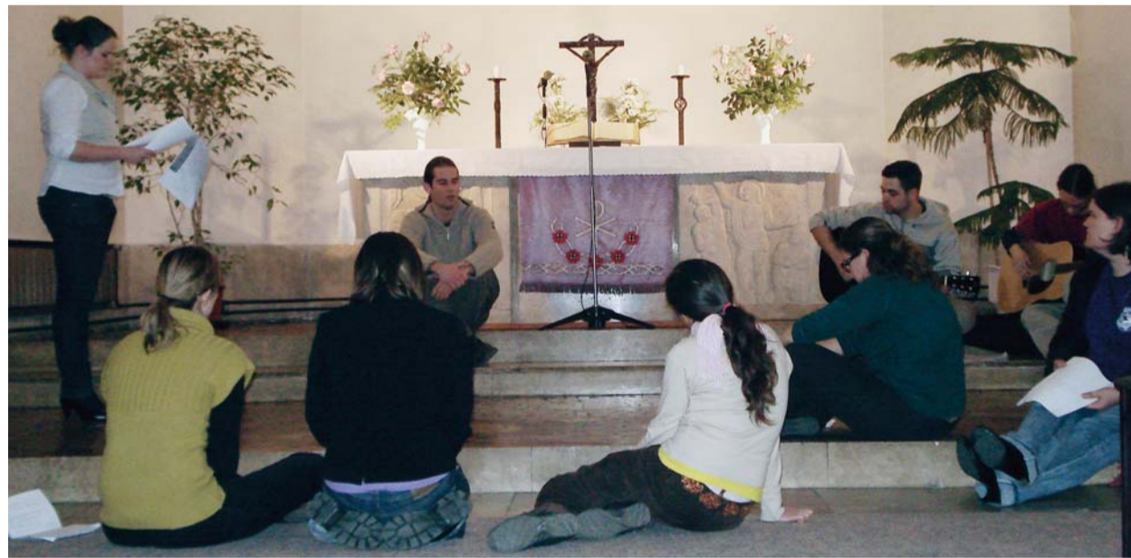
Passiójáték-próba teológushallgató módra

Közben lassan szállingóznak a többiek. Amíg szabadabbá nem válik a teológia tőszomszédságában lévő zuglói templom, a tényleges próba helyszíne, még itt, a kápolnában gyakorolják a zenei betéteket. Odát természetesen a szöveges-párbeszéd részeket sem hagyják ki. Időnként érezni némi feszültséget a leve-