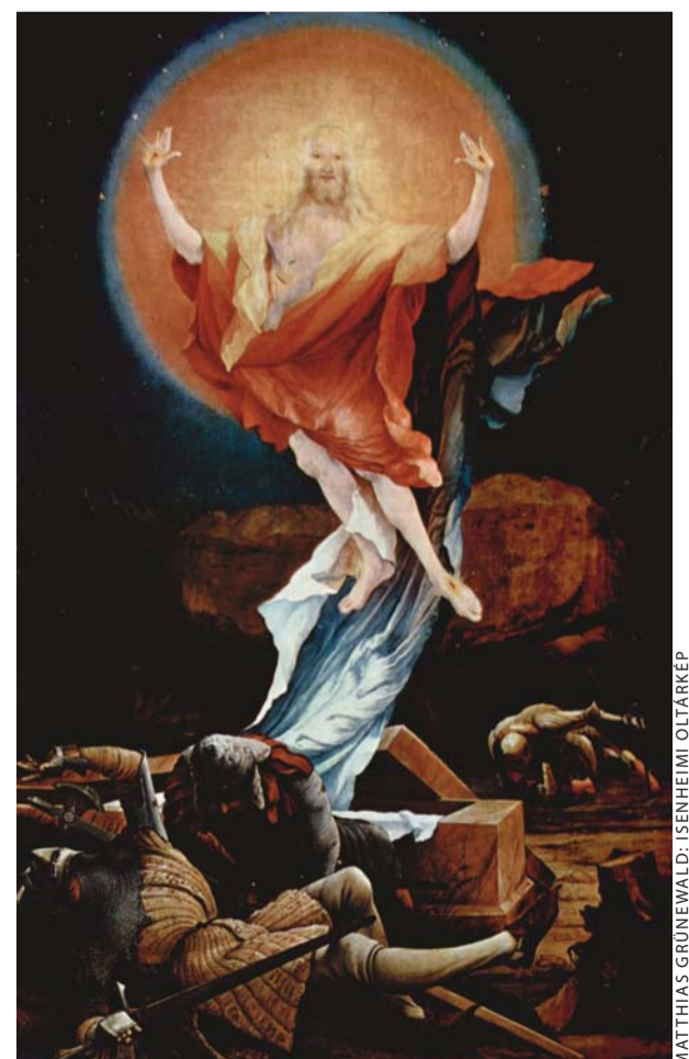
MATTHIAS GRÜNEWALD: ISENHEIMI OLTÁRKEP

S ami a legfontosabb, a szeretettől és örömtől ragyogó arca szinte vonzza a tekintetet, és üzeni: „Ne félj, mert megváltottalak, neveden szólítottalak, enyém vagy!”