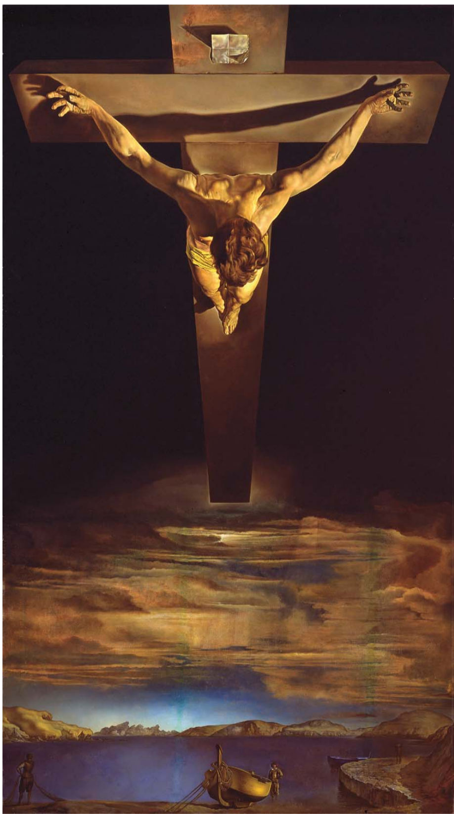
SALVADOR DALÍ: EL CRISTO DE SAN JUAN DE LA CRUZ

Salvador Dalí megfeszített Jézusa nemcsak nagypéntek történéseit hordozza, hanem virágvasárnap üzenete is benne van. Ugyanis a kereszten függő Krisztus tenyerét és lábát nem járja át szög – a Megváltónak nincs szüksége az ember szögeire, hogy a fán maradjon. Önként vállalta küldetését, amelynek fontos része a virágvasárnapi bevonulás is.