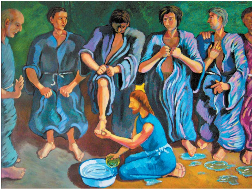
GUIVAS ZSOLT: JÉZUS MEGMOSSA AZ APOSTOLOK LÁBÁT