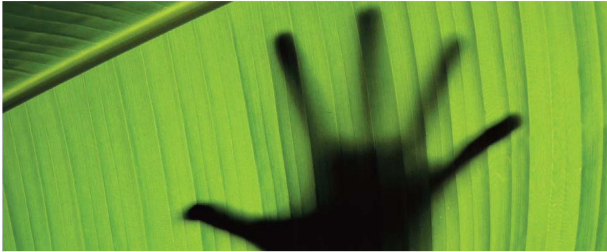
Virágvásárnaptól húsvétig – nagyheti összeállításunk a 8–9. oldalon

„Együtt a bajban” ► 4. oldal Két miért között ► 7. oldal Nagyheti gondolatok ► 8–9. oldal Kereszt-utak ► 11. oldal Síszünet – másképpen ► 12. oldal Húsvét felé ► 12. oldal