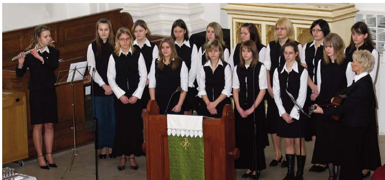
Az orosházi diákok szolgálata a délelőtti istentiszteleten