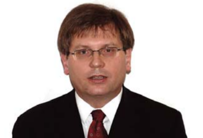
Fabiny Tamás püspök Északi Egyházkerület

Mára szinte már feledésbe merült ez a legenda. Bizonyos, hogy sem a veszprémi bűnözők, sem a bosszúért lihegők nem ismerik. Mondjuk el egyiknek is, másiknak is.