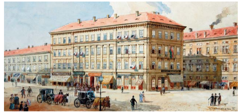
A Deák téri iskola

Az összeállítást válogatta: ■ ZÁSZKALICZKY PÉTER