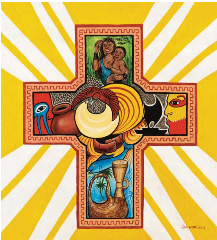
Az ideji imanap logója

előtt a lelkészképző szemináriumba jelentkeztem volna, ápolóként dolgoztam. Evangélikus vagyok, hatmillió lakosú országunkban egymillióan tartozunk e felekezethez.