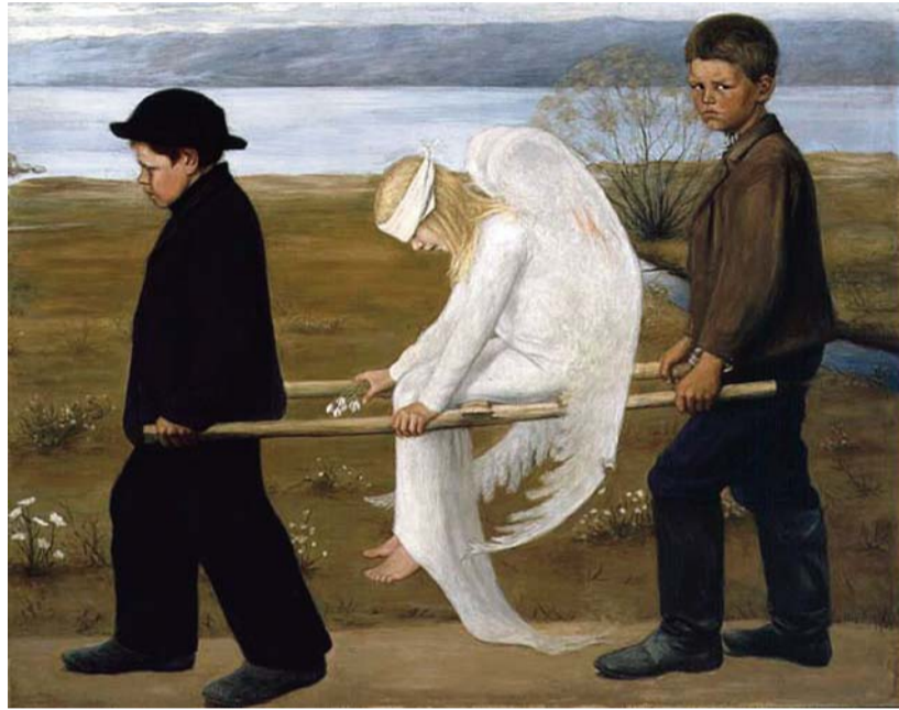
Hugo Simberg: A sebesült angyal (1903)