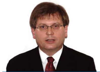
Fabiny Tamás püspök Északi Egyházkerület

A WikiLeaks négy százezer oldalnyi titkos információt hozott nyilvánosságra. Ez a politika és a média területe. Talán mégiscsak különbözik ettől az egyházak világa. A botrányt okozó sok millió mondattal szemben csupán négy szó, a lelkeszi eskü részésként: „A lelkipásztori titkot megőrzöm.” Titkos szolgálat és titkosszolgálat: ég és föld.