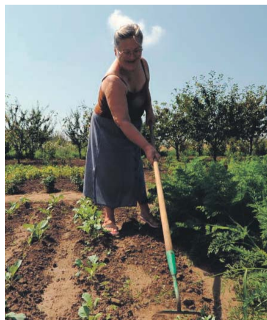
Az átmeneti szálló egyik lakója

Szerzőnk újságíró, a Magyar Rádió munkatársa