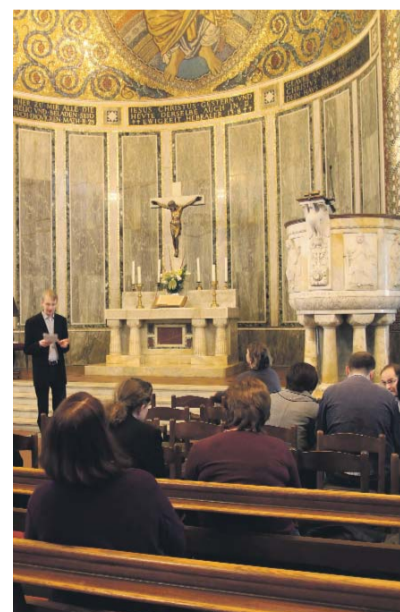
A római evangélikus templomban