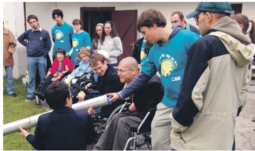
Ép és mozgássérült fiatalok ismerkedtek egymással a Mevisz-Bárka hétvégéjén

Iskola és Gimnázium iskolalelkészétől megtudtuk, minden korosztályt igyekeztek bevonni. Húsz óvodás az Ezüsfenyő Idősek Otthonában Lélek gyümölcsei címmel adott műsort a lakóknak. Az alsósok közül mintegy félszázán a helyi kutya-