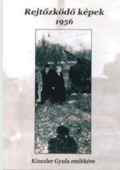
Rejtőzködő képek 1956

Megrendelhető az Evangélikus Országos Múzeumon keresztül. E-mail: eom@lutheran.hu, telefon: 1/317-4173. Ára: kb. 2200 Ft.