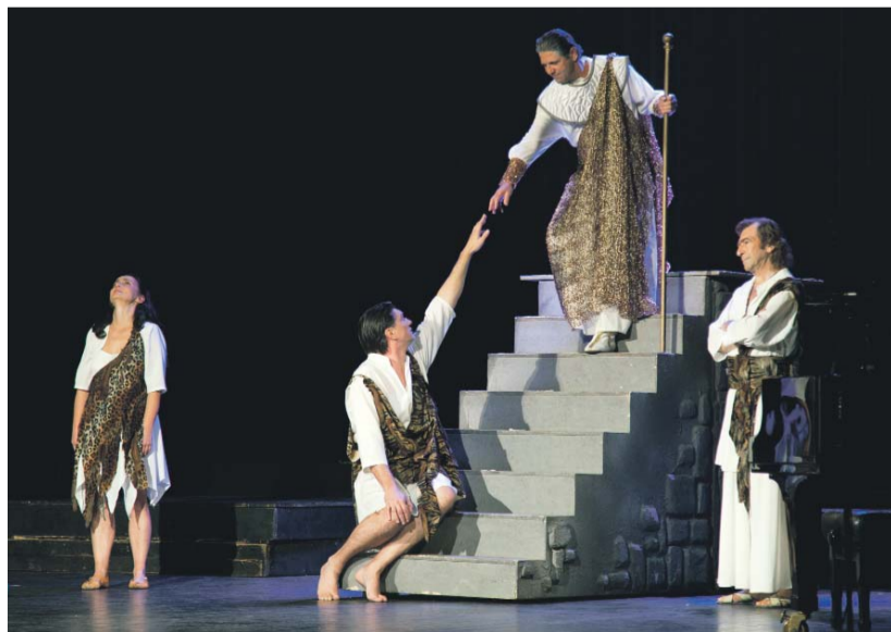
„Mondottam, ember...” – zárókép Az ember tragédiájából

Az est záróprogramja Az ember tragédiájának utolsó színe volt az Evangélium Színház szövegű előadá-