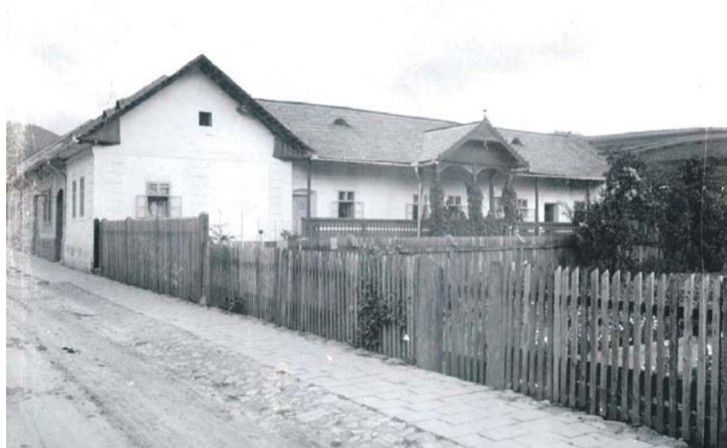
A dobsinai szülői ház

si magyar–német egyház lelkészi teendőit is.