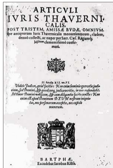
Az 1610-ben kinyomtatott zsinati határozatok címlapja

A fenti rendelkezések megerősítik, hogy a nagy többségében már 1610-ben szlovákok lakta Zsolnán tartott zsinat szlovák anyanyelvű résztvevői,