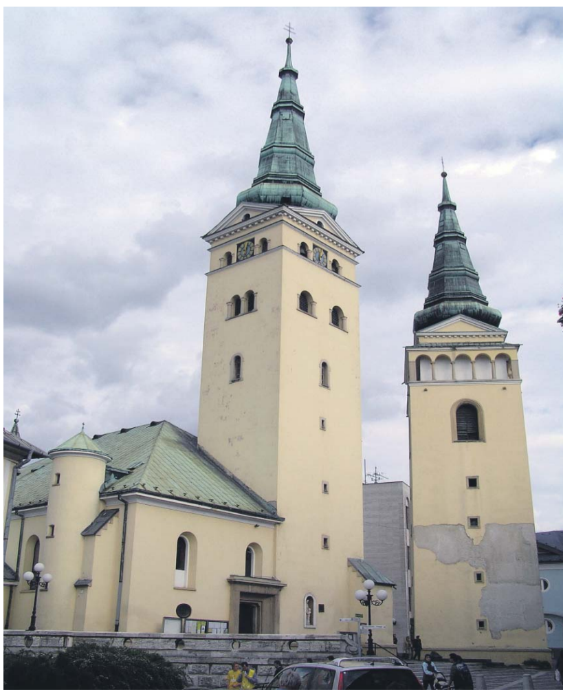
Az 1610-ben még evangélikus zsolnai templom – a zsinat helyszíne