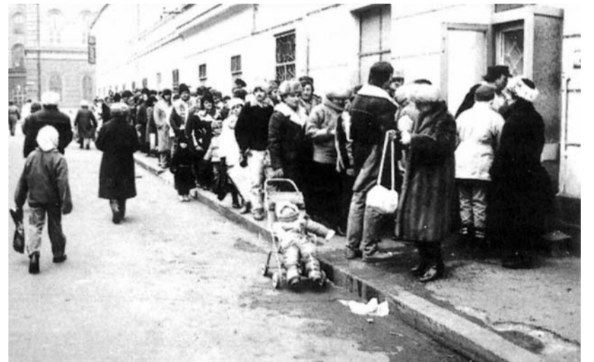
Karácsonyra készülő temesváriak 1989-ben