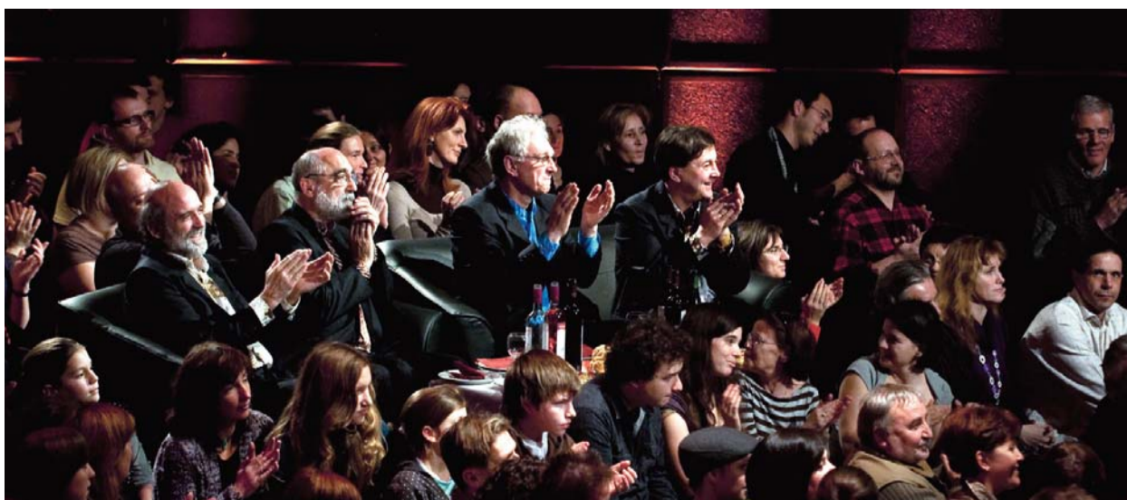
A Kaláka együttes tagjai – ezúttal a nézőtérén...