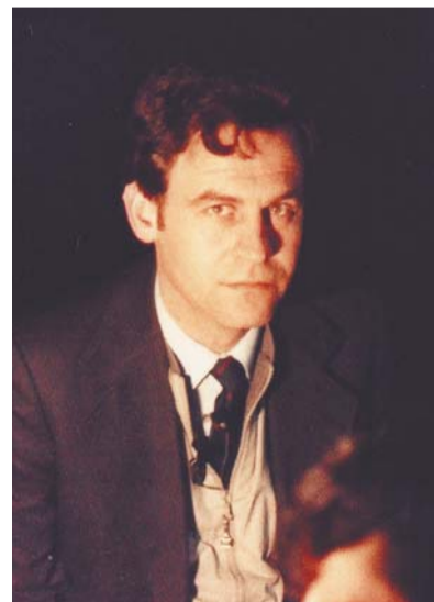
Tőkés László 1989-ben