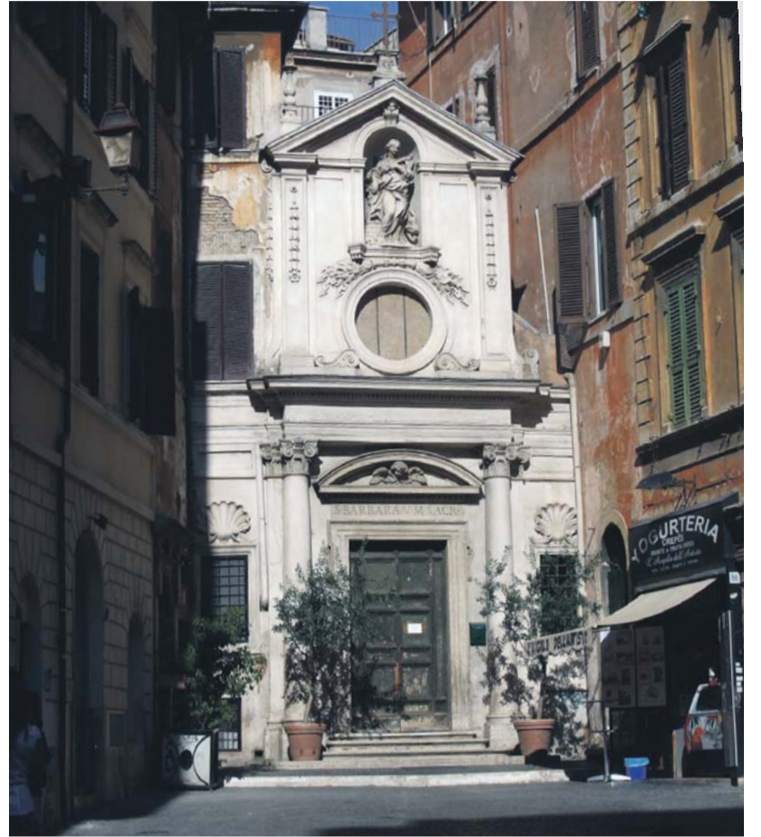
S. Barbara e S. Tommaso d'Aquino dei Libri

Közben erősödik a hang, azután váratlanul olyan ordítás tör ki, hogy megremegnek a környék házai. Zeng a keskeny utca: „Góóóóó!” Gyorsan