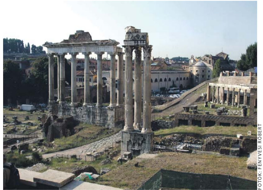
Saturnus és Vespasianus temploma

Kis ajtón át végre beléphetünk mi is. Hát itt vagyok, előttem az, amiért nekivágtam a fásaszó útnak. A