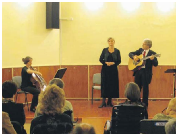
A Poézis együttes

A többségében fogyatékos emberek számára rehabilitációt, munkát és otthon is nyújtó intézményben nemcsak asztalosműhely, nyomda és uszoda működik, de tor-