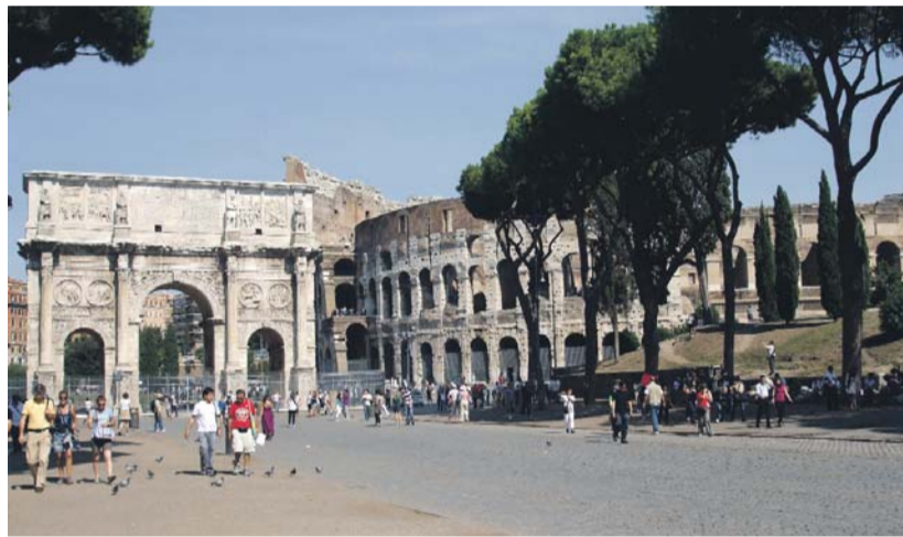
Constantinus diadalívje és a Colosseum

Kápolna. Kora reggeli imádság. Legmélyebb értelme ez lehet: „Adj erőt, Uram, hogy sebzett szívem kibírja a felfedező, hosszú utakat.” És azután: „Adj még erőt, Istenem, hogy elvisel-