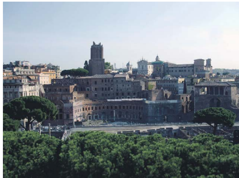
Mercati di Traiano

Mesterek. Hány és hány nagyszerű férfi! Építészek, festők és szorgos szobrászok. A legtöbb töprengve, küszködve dolgozott, sőt volt, aki elégedetlen volt önmagával, és önkézzel vetett véget az életének. Egy kivétel volt: Michelangelo. Ő minden feladatot megoldott, az ő kezében minden arannyá változott. Látástól vakulásig dolgozott. Tervező ceruzát vett elő, éles vésőt, és