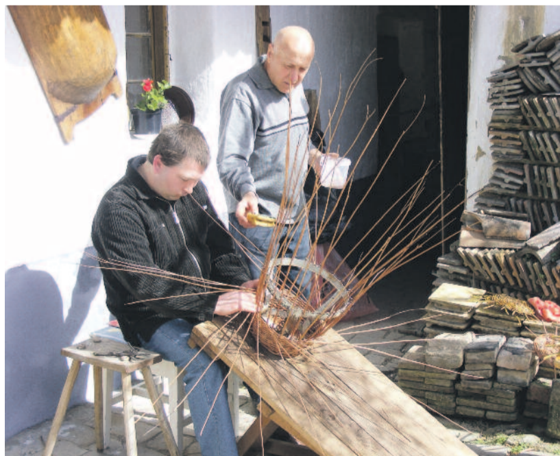
A Mesterségek Házának április 8-ai megnyitóján

sítést is megszerzem. Nagy kérdés volt, hogy mit válasszak: a diplomámnak megfelelő munkakörben vagy valamelyik szakmában helyezkedem el? A látássérülésem miatt a masször szakma mellett döntöttem. Több helyre is pályáztam, de eluta-