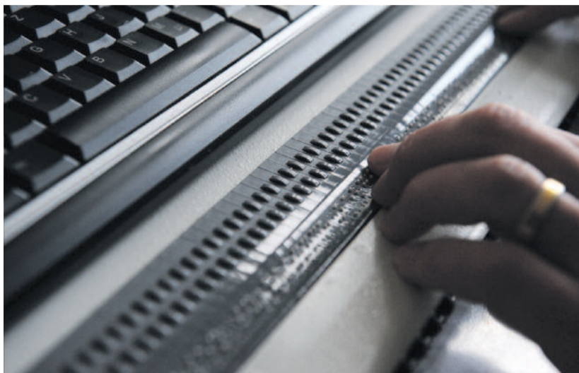
Braille-kijelző használat közben

► Egyre több dolgot intézhetünk on-line: vásárolhatunk, egyetemi, banki vagy egyéb hivatalos ügyeinket intézhetjük, és szinte minden információt megtalálhatunk. Az internet napjaink megkerülhetetlen eszköze, vele a vakoknak is sokkal egyszerűbb és olcsóbb az ügyintézés, a levelezés, kapcsolattartás, mint mondjuk papíron – gondoljunk csak arra, hogy a Braille-írástóknak beszerezése sem könnyű, elég kicsi lévén a választék, és nagy az előállítási költség a hagyományos könyvekhez képest. Sokan viszont el sem tudják képzelni, hogyan lehet a látás képessége nélkül számítógépet használni. Nézzük, hogyan is!