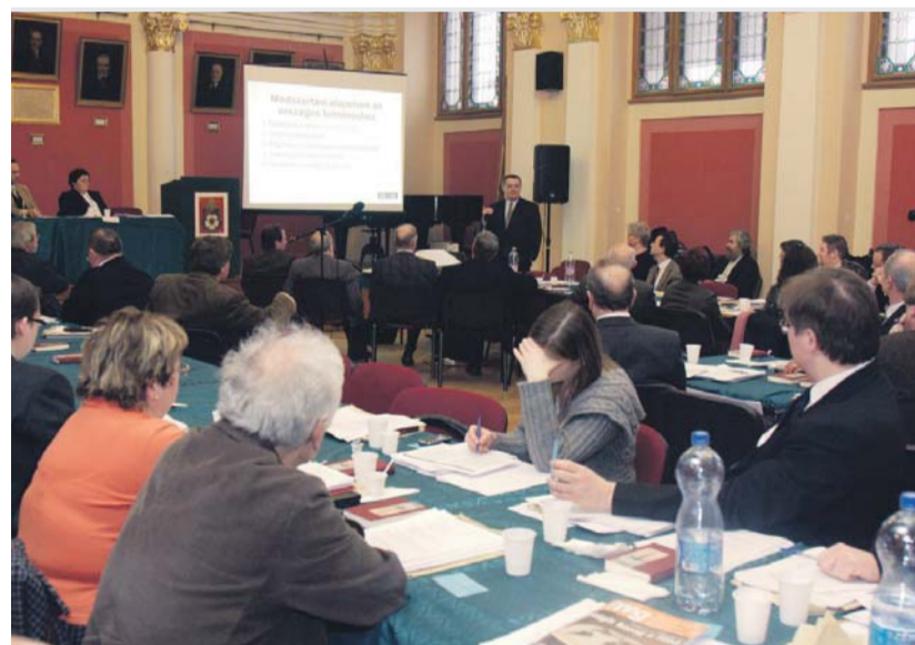
...és 2011 februárjában

Sajnálatosnak kell tekintenünk azt, hogy – feltehetően a kommunista időkben kialakult püspöki diktatúra újraéledésének lehetőségét megakadályozandó – a püspöki jogkört szükségtelenül szűkítette a zsinat. Bizonyos döntéseknél egyenesen mellőzik törvényeink a püspök véleményének kikérését, holott a problémá-