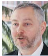
Evangelikus istentisztelet a Magyar Televízióban

Megépítése óta nem sokat változott az Öregtemplom. Komoly veszélybe