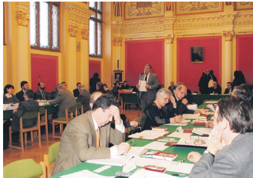
Zsinati ülés 2004 februárjában...

A magyarországi evangélikusság a rendszerváltozás után az egyház megújulását részben a lelkiekben való megújulás révén, részben „személyi vonalon”, részben pedig az egyházi struktúra megújításával kívánta elérni.