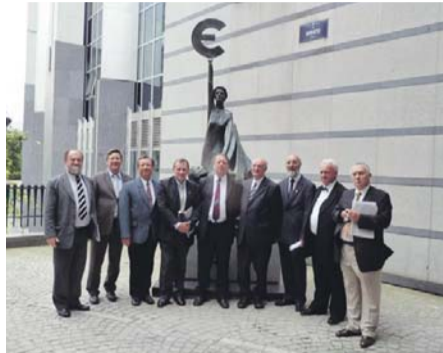
Brüsszeli csoportkép a magyar delegációról

rópai Unió intézményeiben elmondják a maguk tapasztalatait, beszámoljanak eddig végzett munkájukról és további terveikről az integráció folyamatát illetően. Másrészt megbeszélésekre is sor került az Európai Egyházak Konferenciájának tisztségviselőivel a programok értékeléséről, valamint további konkrét tervek kialakítása érdekében.