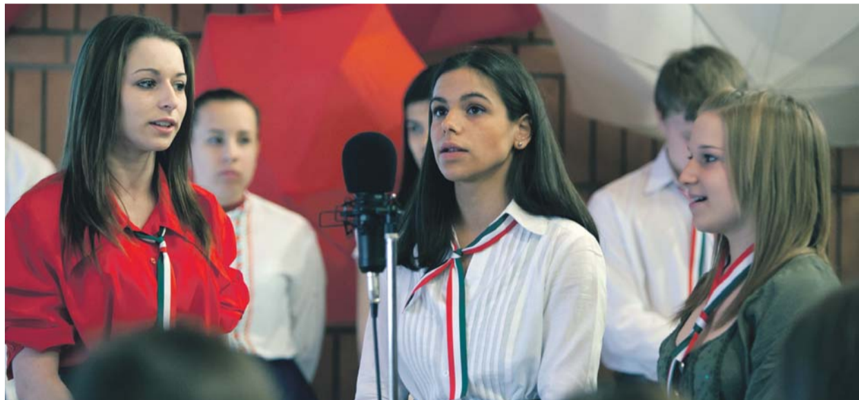
A Petőfi-nap ünnepi megemlékezéssel kezdődött