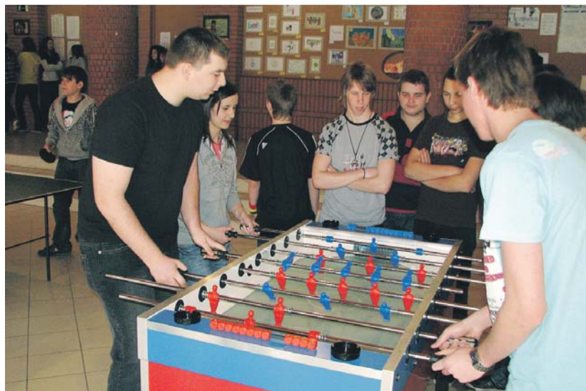
A csocsóbajnokság nevezési díja is a célt szolgálja

Diákjaink mindennap jótékonyági koncerten vehettek részt, melynek előadói iskolánk tanulói voltak. A be-