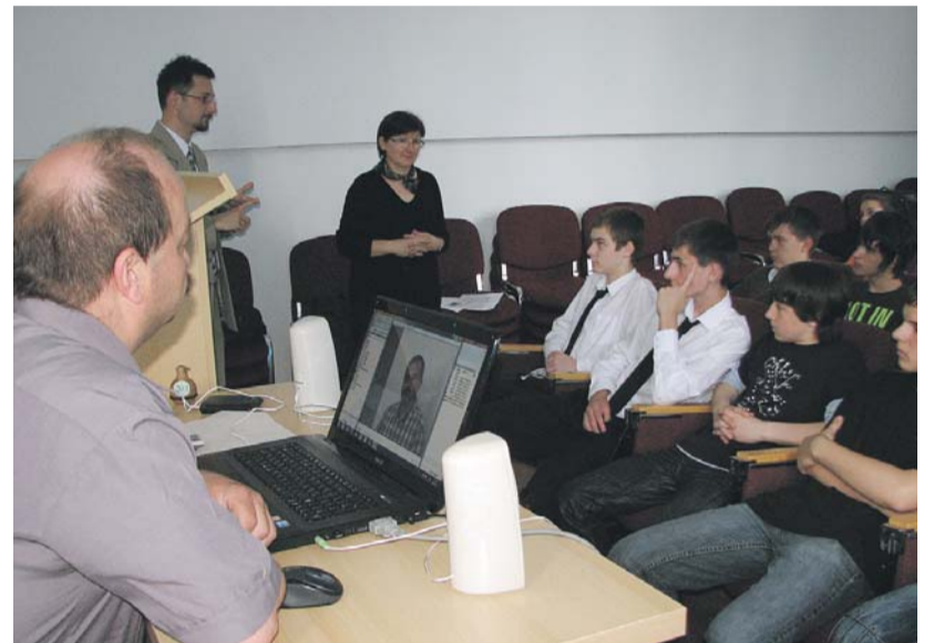
A diákok felkészítése

Az interjúalanyok kiválasztásánál elsődleges szempont volt az aszódi evangélikus iskolához való kötődés, a helyi evangélikus gyülekezetben vállalt aktív szerep (felügyelő, presbiter, lelkész), a helyi közéleti szerep (tanácselnök, polgármester, intézményvezető), a településünkön és környékén folytatott gazdasági, kul-