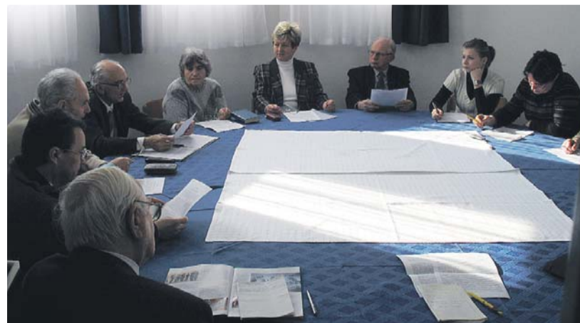
Olvassunk együtt Luthert! – csoportmunka

szűz közül öt nem vitt magával olajat, mert nem hitt abban, hogy megérkezett a pólegény. Ha oly könnyen feladjuk például Krisztus visszajövetelének reményét, mi is elmulasztjuk a nagy alkalmat. Addig kell élni a le-