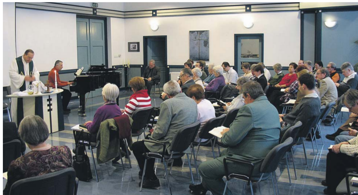
Úrvacsorai záró istentisztelet

kapcsolatos élménye is volt, és amire reformátorra érve is újra meg újra visszaemlékezett: és ez nem más, mint az Isten haragjától és ítéletétől való fenyegetettség állandó érzése, amit a középkori templomok freskói és oltárképei is sugalltak. (...)