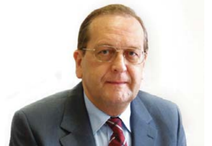
Ittész János püspök Nyugati (Dunántúli) Egyházkerület

Mégis van reménység a szívemben. S tudom, hogy ez reménység nem szegényül meg, mert nem emberek ígéretére épül, nem politikai változásokon tájékozódik. Európai polgárként aggódhatom, számos okom is van rá; de minden keresztény testvéremmel együtt vallom, hogy nekünk kettős állampolgárságunk van, és ez reménységünk végső alapja: „ Nekünk a mennyben van polgárjogunk, ahonnan az Úr Jézus Krisztust is várjuk üdvözítőül... ” (Fil 3,20)