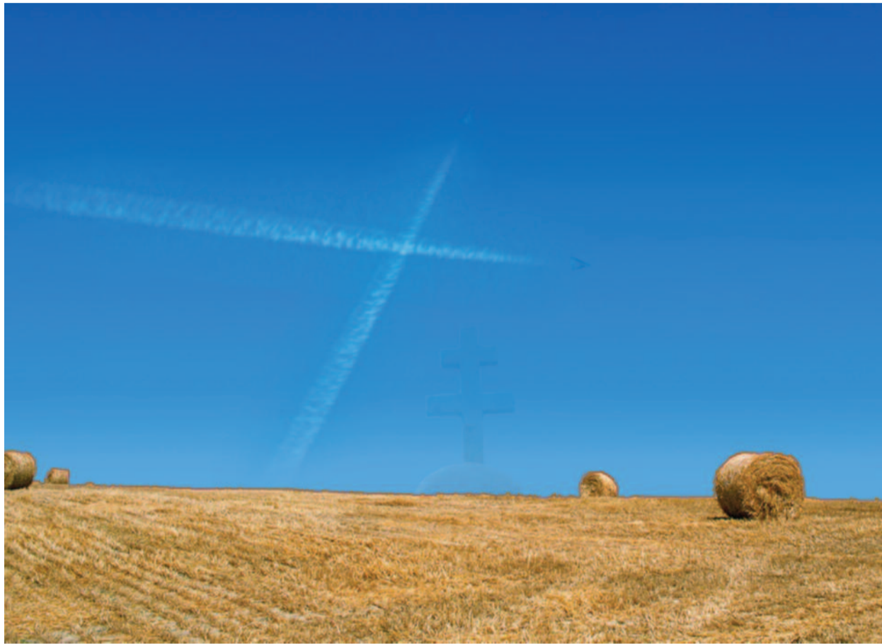
KAROLY GYÖRGY TAMÁS MONTAZSA

Hogyan ünnepeltek a protestánsok? ▶ 5. oldal Találkozások Böjte Csabával ▶ 16. oldal Interjú az új kerületi felügyelővel ▶ 18. és 23. oldal Bibliai tudáspróba ▶ 24. oldal Szélrózsa-visszapillantó ▶ 26. oldal Melléklet: ÚTTITÁRS – magyar evangéliumi lap