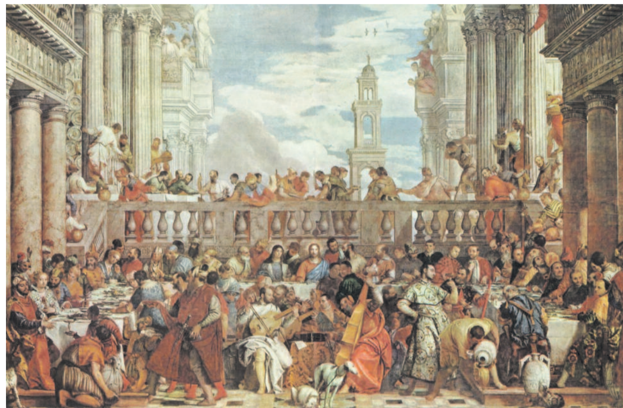
PAOLO VERONESE: KÁNAI MENYEGZŐ