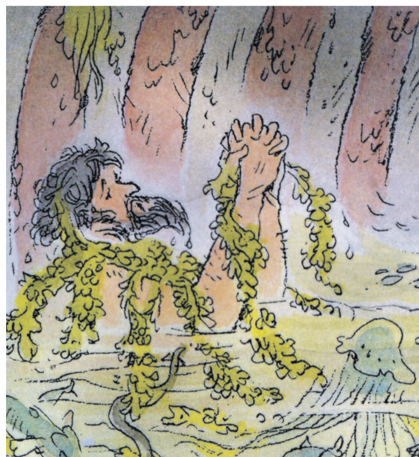
PETER SPIER: JÓNÁS IMÁJA A CET GYOMRÁBAN (RÉSZLET)