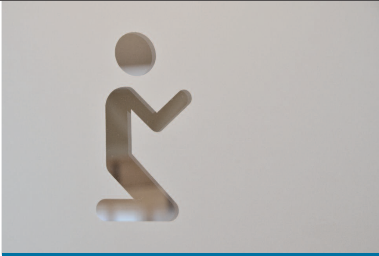
A LISZT FERENC REPÜLTŐTER OKUMENIKUS KÁPOLNÁJÁNAK AJTÁJARÓL

„Eljön az a nap...” ► 2. oldal Lelek és tudomány ► 4. oldal Szentseges láncreakció ► 4. oldal Égi test ► 5. oldal A megváltás titka ► 5. oldal Ne vígy minket kísértésbe? ► 6. oldal