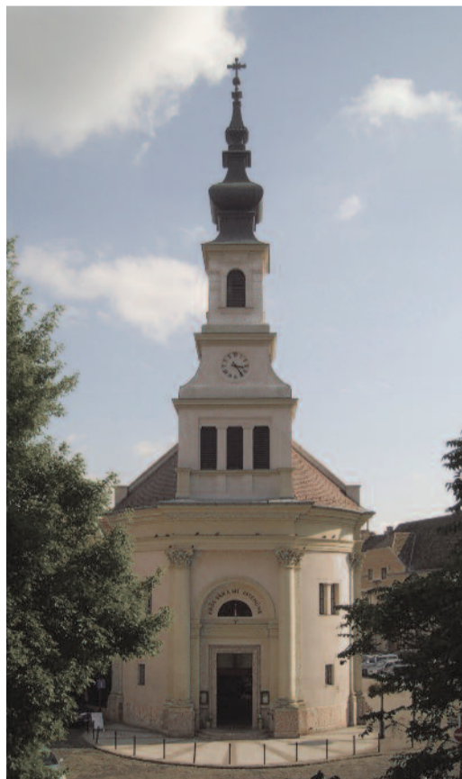
Evangelische Kirche im Burgviertel (Budapest)