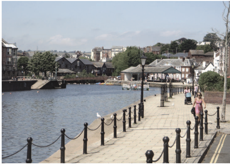
Exeter, a „Rakpart”

tó ötletekkel gazdagodhattunk, melyeket szeptembertől saját csoportjainkban tesztelhetünk.