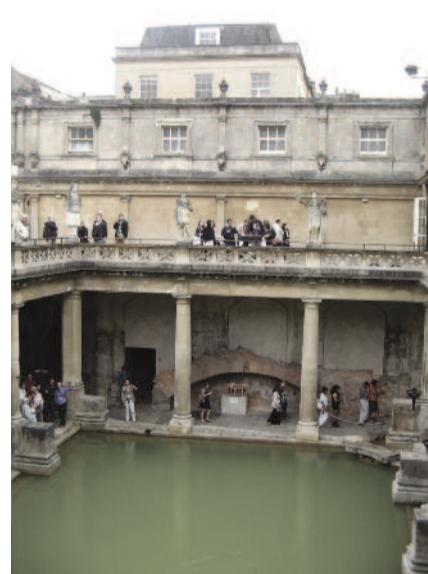
Látogatás Bath római fürdőjében

A második hét egy-egy napján a részt vevő tanárok is „vizsgáztak”. Egy adott témát egy kollégával közösen feldolgozva bemutathattuk, hogy milyen módszerekkel közelítjük meg, tesszük diákjaink számára emészthetőbbé. Kezdetben az „akasztják a hóhért” hangulat uralkodott a teremben, hiszen tanárokat tanítani valóban nagy kihívás. Végül azonban mindenkinek sikerült a feladatot – újabb és újabb, változatosnál változatosabb módszereket bemutatva – abszolválni, így mindennapi tanítási gyakorlatunkba beépíthető, a tanórákon hasznosítha-