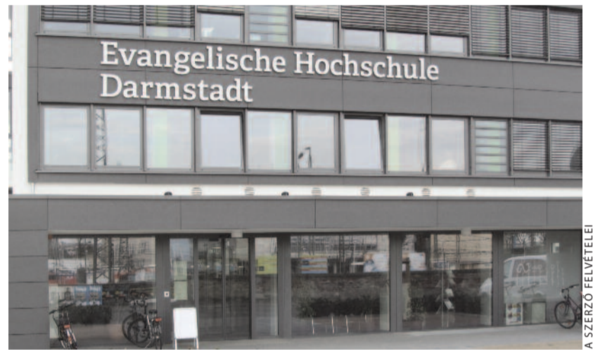
A Darmstadti Evangélikus Főiskola főépülete

Effata: arám szó, jelentése „nyílj meg”. Jézus ezt mondta a dadogó süket meggyógyításakor (Mk 7,32–35): „Ekkor egy dadogó süketet vittek hozzá, és kérték, hogy tegye rá a kezét. Jézus félrevonta őt egymagában a sokaságból, ujját a süket fülébe dugta, majd ujjára köpve megérintette a nyelvet; azután az égre tekintve fohászzkodott, és így szólt hozzá: »Effata, az-az: nyílj meg!« És megnyílt a fülle, nyelvének bilincse is azonnal megoldódott, úgyhogy hibátlanul beszélt.”