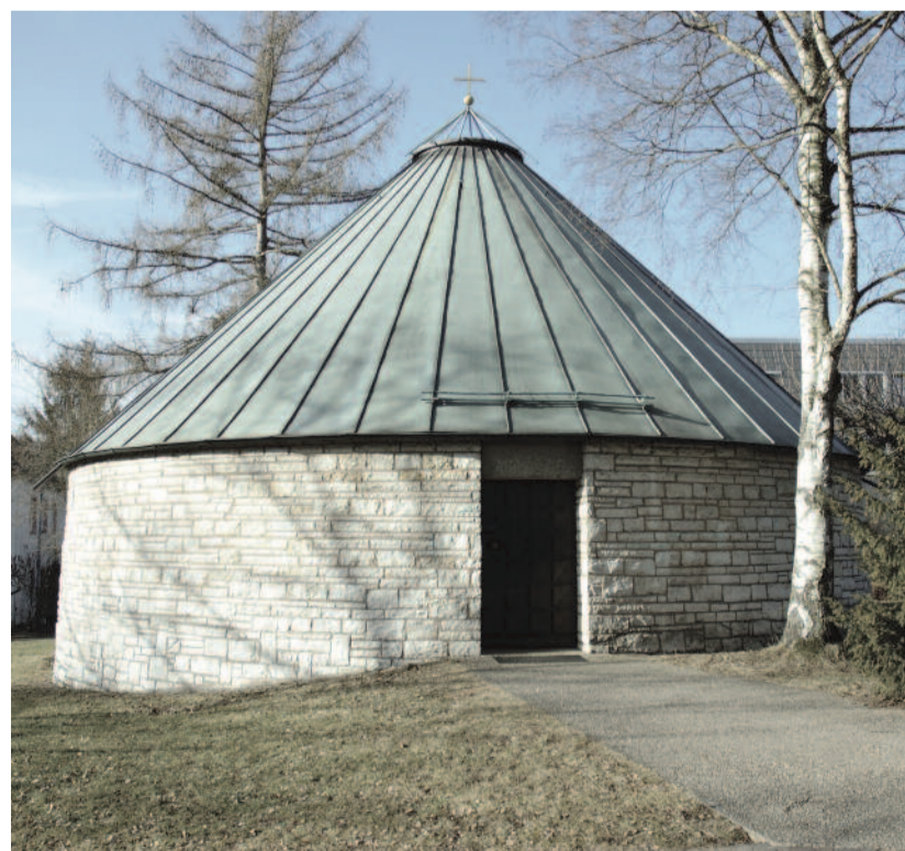
Jurtakápolna a főiskola parkjában

köszönhetően a főiskola vezetőivel, oktatóival, lelkészével és hallgatóival való személyes beszélgetések mellett ízelítőt kaphattam a főiskola mindennapi életéből is.