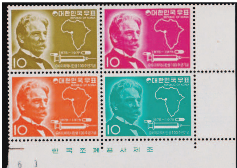
DEL-KOREAI BÉLYEG A SCHWEITZER-CENTENÁRIUMRA (1973)

Terveit jórészt derékba törte kórházi működésének betiltása, előbb házi őrizetbe helyezése, majd Afrikából való kitoloncolása, végül egy