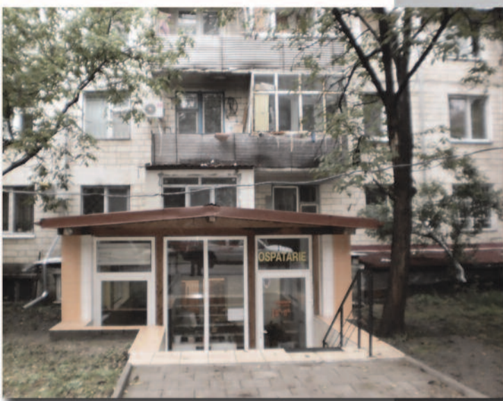
A chişinăui gyülekezet központja...