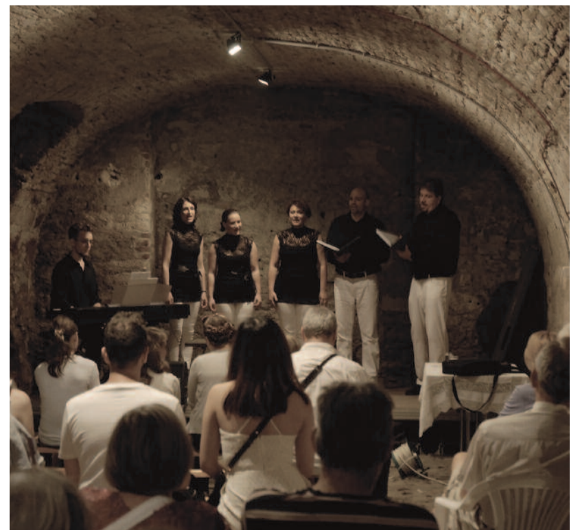
Éneklők (Cantus Ludus)