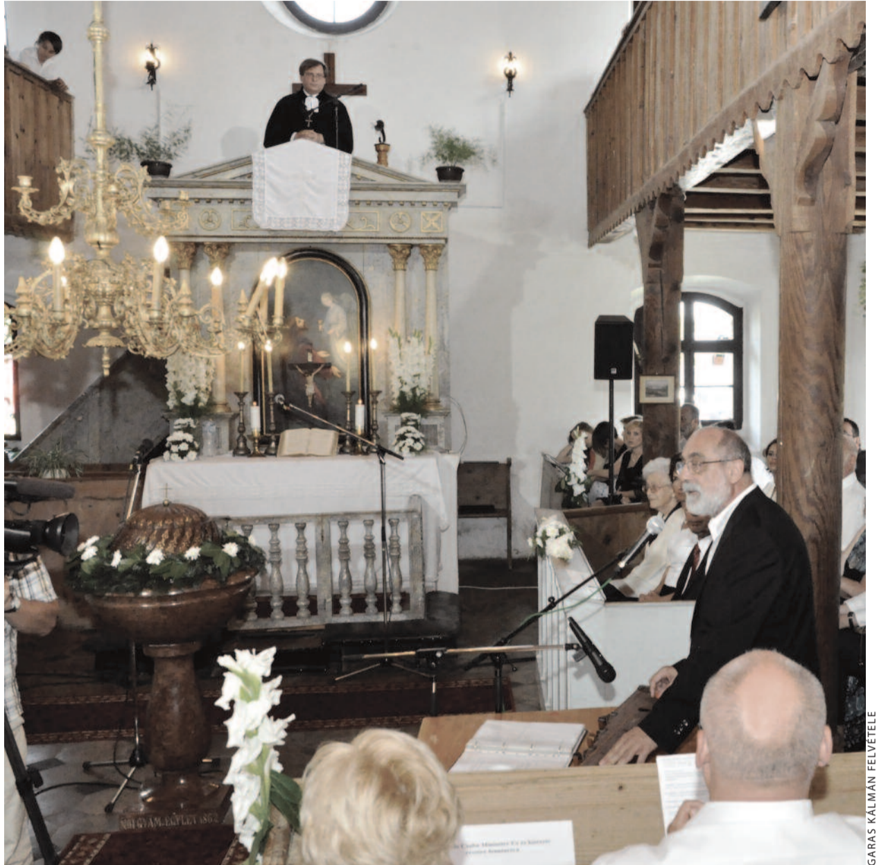
Dialógusprédikáció: Fabiny Tamás püspök és Gryllus Dániel előadóművész