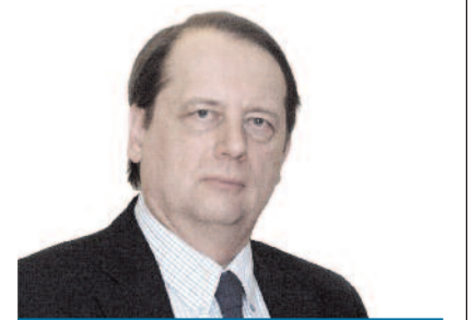
Gáncs Péter püspök Déli Egyházkerület

A Szentháromság Istennek ezekről az ajándékairól éneklünk az Evangélikus énekeskönyv 68. énekének 5–6. versében is, amely lehet akár az induló nyár „hymnusza”: „Felüdülés, sport, zene, játék, / Zengjetez Istennek új éneket! // Kicsik-nagyok, jer, kéz a kézbe: / Zengjetez Istennek új éneket! / Csodáin ámulva ujjong szívem. / Én is új dallal dicsérem.”