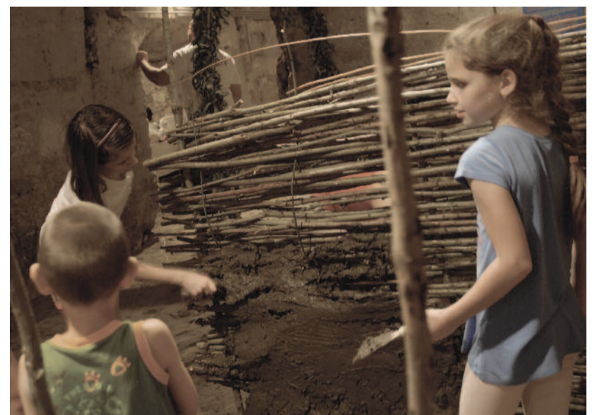
Építők (az üldözések idejének templomépítési technikája: vesszőből font, sárral tapasztott paticsfal)

A felekezetek jellemző tárgyai között különböző, a liturgiában használatos eszközök, például úrvacsorai kelyhek, kannák, kéziratok korál-