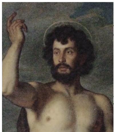
KERESZTELŐ JÁNOS – ISMERETLEN FESTŐ MŰVE

A Nap, amely a téli napfordulótól kezdve fokozatosan egyre magasabbra hág az égen, a nyári napforduló vagy nyárközép június 24-ére eső dátumán éri el pályájának csúcspontját. Ezt a határnyelvi periódusa követi.