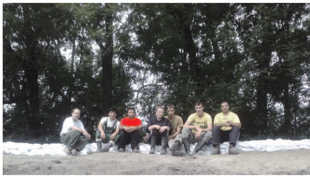
Dunaszentpál (Zselykepuszta) gátján a kőszegi evangélikus középiskolát képviselő diák önkéntesek