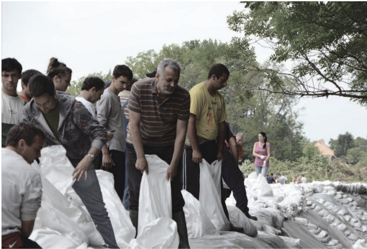
Evangelikus önkéntesek a gáton ▶ R riportunk a 9. oldalon

A kereszt bölcsessége ▶ 2. oldal Mennyei zene a Bach-héten ▶ 4. oldal Fancsali filagória ▶ 4. oldal Éltető találkozás a kúriában ▶ 5. oldal Üdülhet a lélek is... ▶ 7. oldal Melléklet: ÚTTÁRS magyar evangéliumi lap