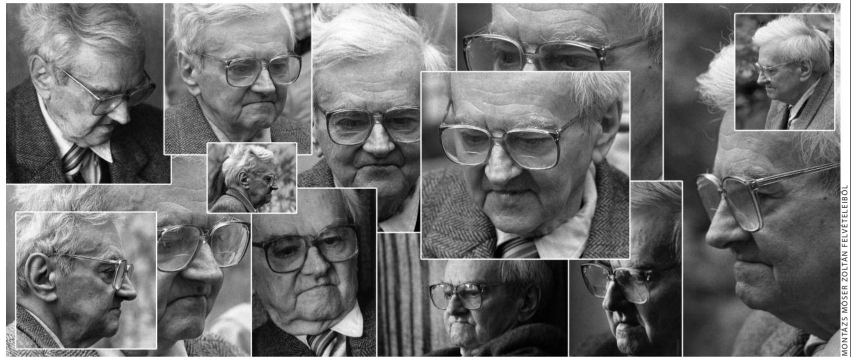
MONTÁZS MÓSER ZOLTÁN FELVÉTELEIBŐL

elénk tárja a sokféleségben felfedezett egységet. Kérdeznek a másodpercek, és válaszolnak az évszázadok.