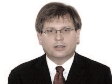
Fabiny Tamás püspök Északi Egyházkerület

Nézem az árvízi kelyhet. Szeretném hinni, hogy a rajta levő ábrázolás ma is érvényes. Templom, nyitott ajtókkal. Evangélikusok, nyitott szívvel. Nem önmagunk körül forgó, hanem másokért élő egyház vagyunk. Néhai Lang Mihályhoz és a pesti egyház evangélikusaihoz hasonlóan mi is készek vagyunk segíteni a bajba jutott emberen. Ha kell, ígével, ha kell, homokzsákkal. Lelkészeink és híveink közül sokan imádkoznak a bajba jutottakért, valamint ott állnak a gátakon. Teszik, mert ez a dolguk. Akkor is, ha az árvíz elmúltával nem készül aranyozott ezüstkehely, hogy tetteiket megörökítse.